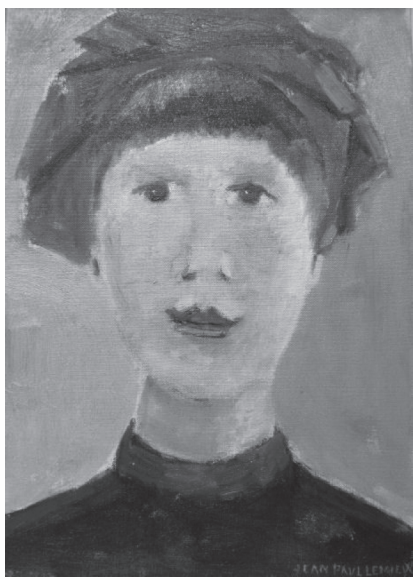
Jean-Paul Lemieux - jeune fille au bandeau rouge - Halk sur toile