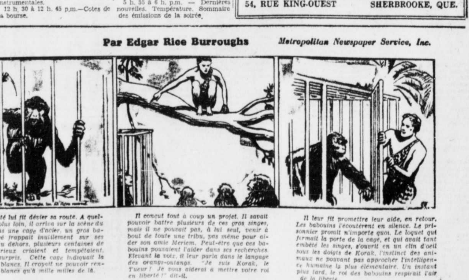
Koraik, tout à fait rétabli, après plusieurs semaines de repos forcé, se mit à la recherche de Meriem. Il se retrouva avec joie au milieu des arbres. Comme c'était reposant et plaisant de se balancer encore une fois d'arbre en arbre, et mettre en jeu tous ses muscles puissants! Toutois, la vie lui paraissait sans intérêt sans la compagnie de Meriem. Il entendit, ce soir-là, une bande de babouins qui faisaient grand tapage.

Le Fils de Tarzan No. 55 Par Edgar Rice Burroughs Metropolitan Newspaper Service, Inc.