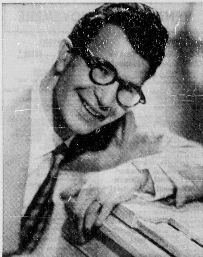
JAZZ MODERNE — Dave Brubeck, pianiste de renom, est sans contredit l'un des interprètes les mieux connus du jazz moderne. Il sera invité à la première de "Chrysler Festival", à 19 heures, mercredi, à CBOT.

Emission spéciale d'une heure télédiffusée directement de la Foire royale d'hiver; on verra plusieurs étalages venant de diverses parties du pays, les concours 4-H pour l'élevage des animaux de ferme (3h.30 jeudi).