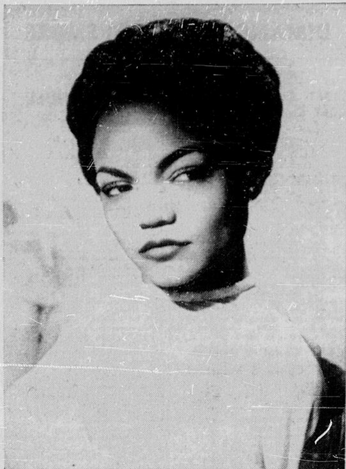
"THAT BAD EARTHA" — Eartha Kitt sera parmi les artistes qui tiendront la vedette à l'émission "Chrysler Festival", qui sera présentée six fois cette année et en première mercredi, 14 novembre, à 10 heures, à l'écran de CBOT.