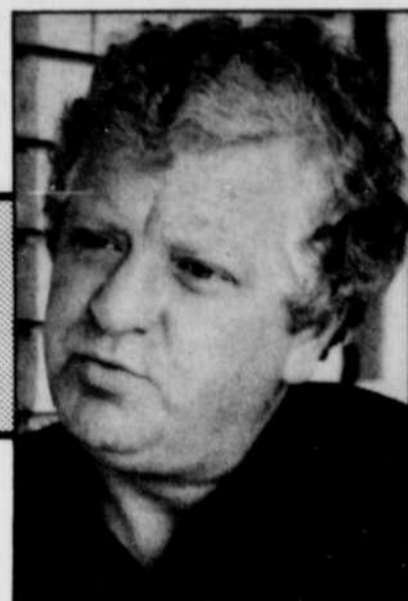
Examens mécaniques ?

tion: "Tout coûte de plus en plus cher. Et c'est plus que normal que les primes d'assurance coûtent de plus en plus cher aussi, que ça suive au moins le taux d'inflation. Person-