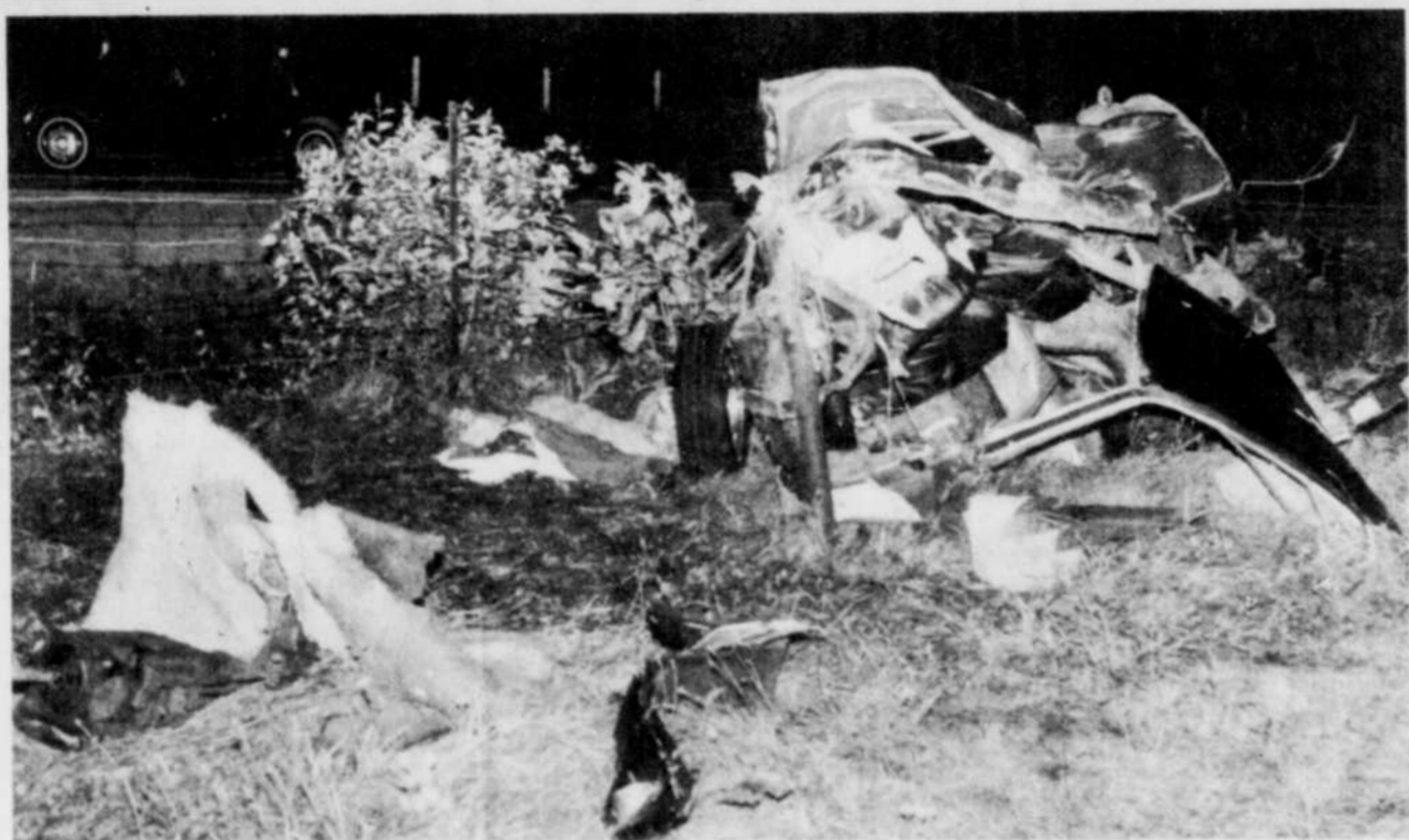
La voiture des victimes s'est pratiquement désintégrée sous la force de l'impact sur le chemin Saint-Edwidge en début de soirée samedi.

Le dérapage est survenu quelques minutes après 19 heures samedi, sur le chemin Saint-Edwidge, et ce sont les policiers de la SQ, poste de Coaticook, qui se sont rendus sur les lieux.