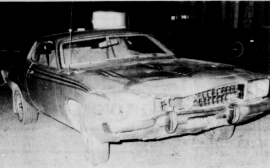
La voiture conduite par l'adolescent et qui a fauché trois vies humaines à Coaticook au cours du week-end...

LA COMMISSION SCOLAIRE REGIONALE EASTERN TOWNSHIPS 257, Queen, Lennoxville (PQ) (819) 569-9468, ext. 56