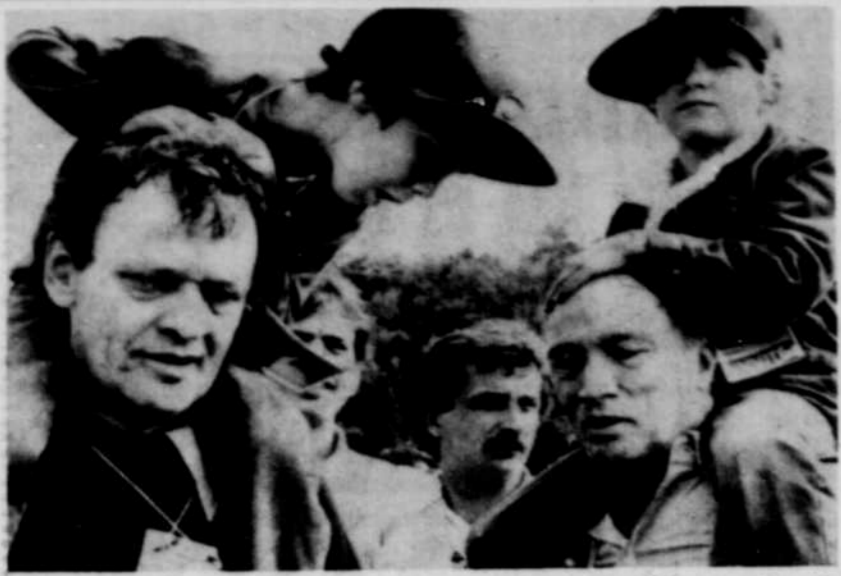
Sacha et Michel Trudon semblent être confortablement installés sur les épaules du ministre Jean Chrétien et du premier ministre Trudeau, lors d'une fin de semaine de camping en Mauricie.