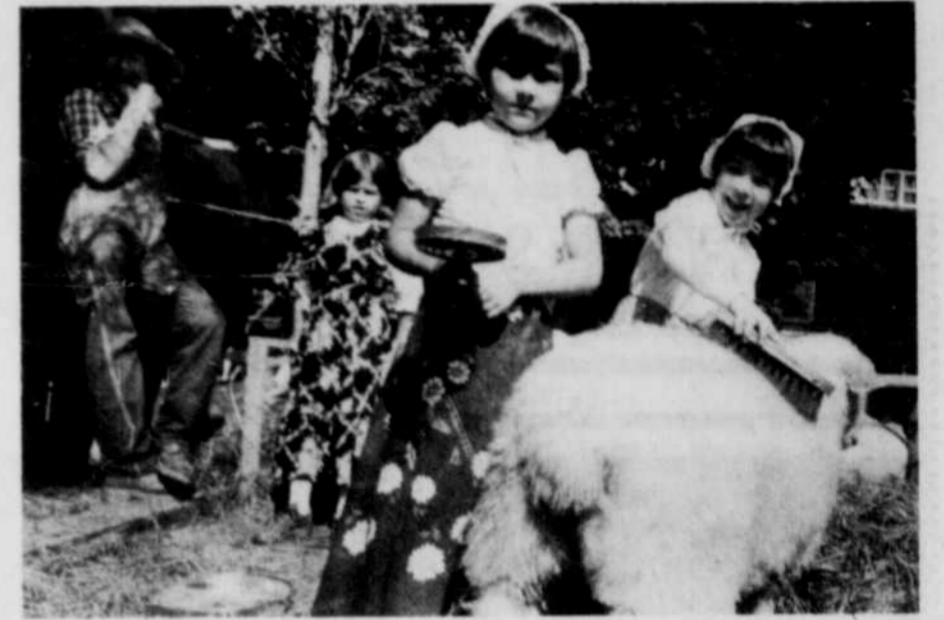
Oui, c'était un véritable mouton que des enfants brossaient lors de la parade soulignant le 125e anniversaire de Compton en fin de semaine dernière...