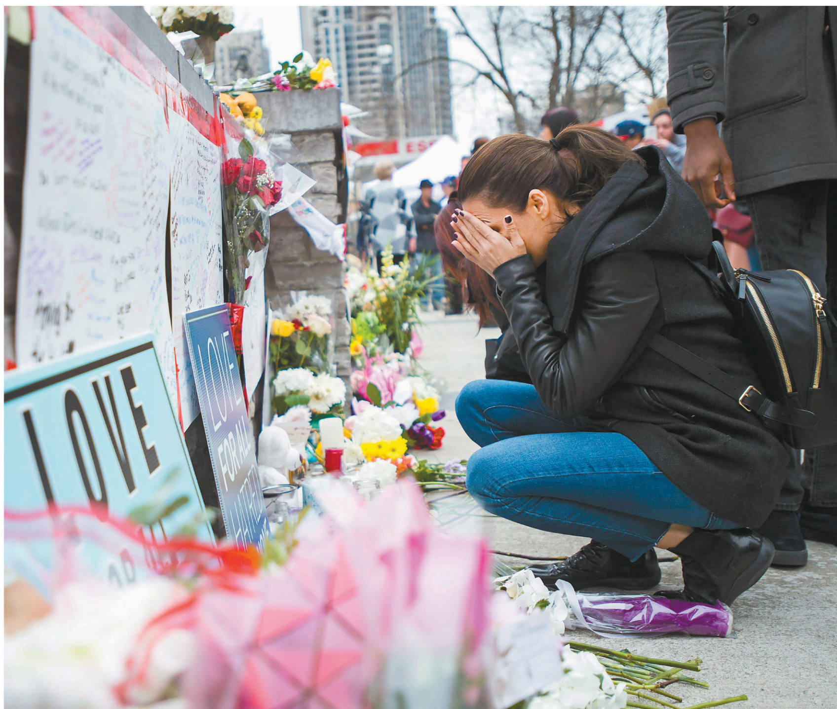
Une femme se recueille près de l'endroit qui a été le théâtre de l'attaque au camion-bélier, lundi.