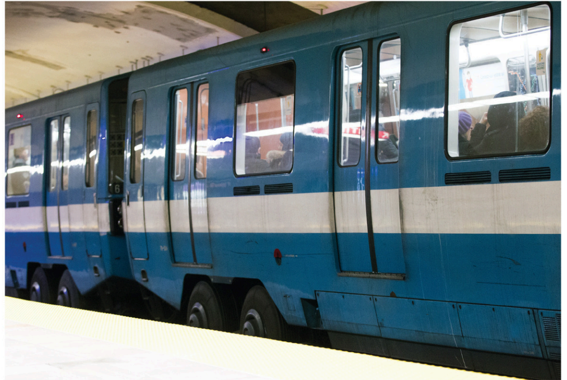
ANNIK MH DE CARUFEL LE DEVOIR

Après qu'Alstom eut annoncé que les voitures du Réseau express métropolitain (REM) seraient construites en Inde, le premier ministre Couillard s'est rendu à La Pocatière le 13 avril afin de rassurer les travailleurs de Bombardier: Québec allait faire adopter un projet de loi pour prolonger le contrat des voitures