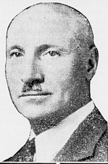
L'hon M. Alfred DURANLEAU