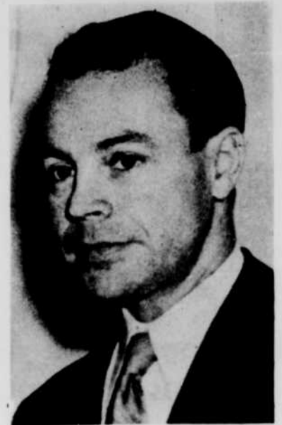
Bertrand Vac, l'auteur de Louise Genest dont l'adaptation radiophonique marquera le début d'une nouvelle série d'émissions dramatiques consacrées aux Grands Romans canadiens.

Les Nouveautés dramatiques , qui étaient entendues à 9 h. 30 le dimanche soir, seront interrompues durant deux semaines. Elles reprendront le 20 avril, à 9 h. 30 et se continueront le vendredi soir jusqu'à la fin de la saison.