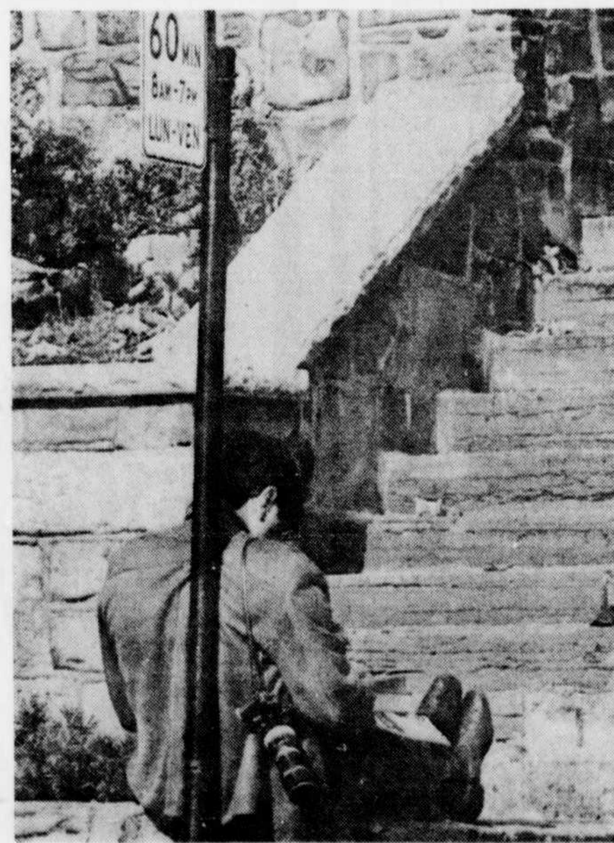
UNE LONGUE ATTENTE — Comme tous les corps de police, les gouvernements, et la population entière, un journaliste attend, devant la résidence du diplomate kidnappé par les terroristes, les événements qui devraient, d'ici quelques heures éclaircir ou précipiter le drame. Dernier délai à midi... ou une négociation?