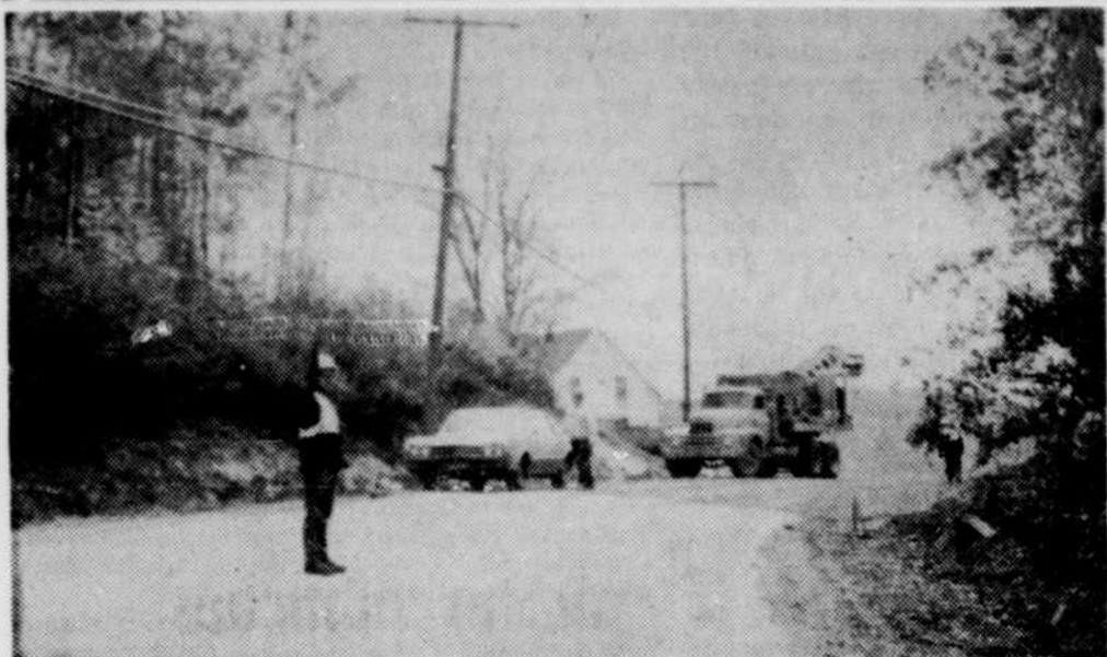
La route situé entre Beebe et Rock Island sera repavée à partir du garage Esso à Beebe jusqu'aux douanes à Rock Island. De plus on a abaissé d'environ 18 pouces une partie de ce chemin situé dans une courbe près de Beebe. C'est la voirie provinciale qui effectue ces travaux. On aperçoit ci-dessus la courbe qui a été abaissée près de la municipalité de Beebe. Il s'agit au total d'une distance de près de 4 milles.