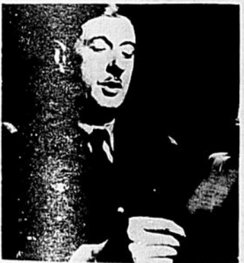
Le Général de Gaulle, chef de la Résistance française, au micro de la B.B.C., le 18 juin 1940, à Londres.