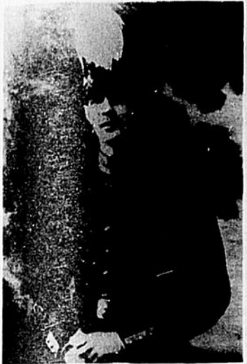
Le futur sauveur de la France, Charles de Gaulle, en uniforme de l'École spéciale militaire de Saint-Cyr, 1910-1911.