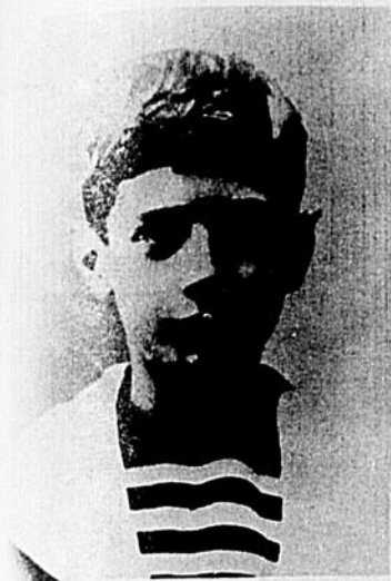
Charles de Gaulle, enfant. Il naquit à Lille, le 22 novembre 1890.

"Le Ministre des Postes à Ottawa a autorisé l'affranchissement en numéraire et l'envoi, comme objet postal de deuxième classe, de la présente publication."