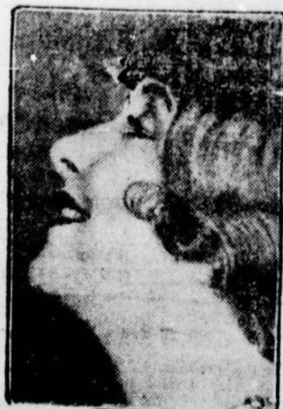
Mildred Harris, une autre beauté de l'écran. D'abord tout alla bien puis...