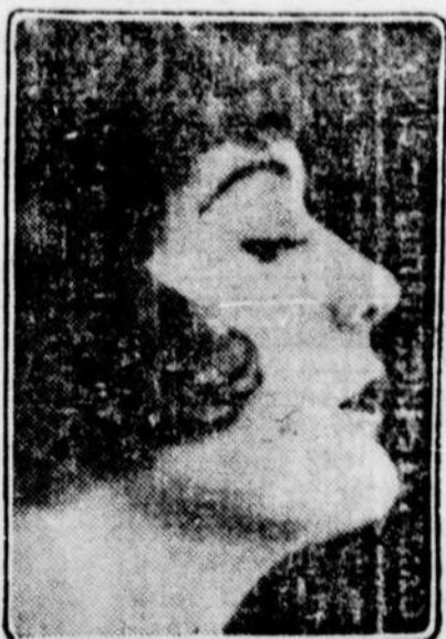
Lita Grey, âgée de 18 ans. Deux fils naquirent de ce mariage. Et... l'autre jour...