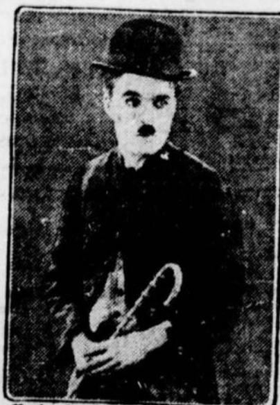
Charlie Chaplin, grand comédiens, désirait intérieurement jouer le rôle de tragédien...