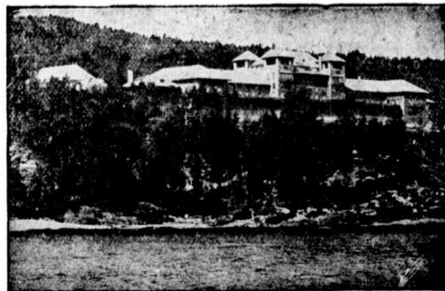
MANOIR RICHELIEU, MALBAIE