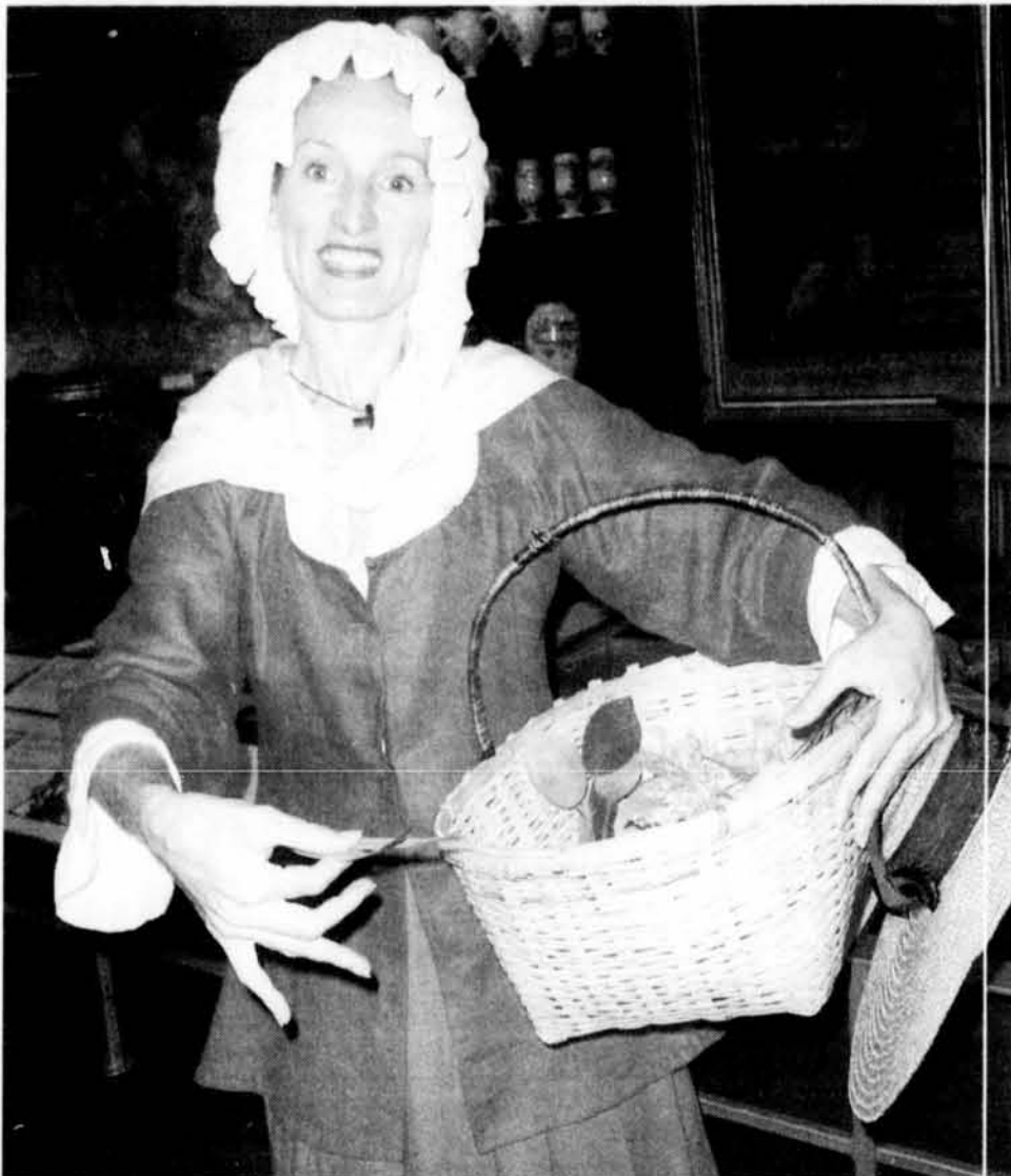
Une comédienne de la troupe Dramamuse jouait le rôle d'une sage-femme lors de l'inauguration de l'exposition «Il était une fois en Amérique française».

«Il était une fois en Amérique française», au Musée canadien des civilisations (100, rue Laurier, secteur Hull), jusqu'au 28 mars 2005. Pour en savoir plus sur les activités de la programmation: www.civilisations.ca