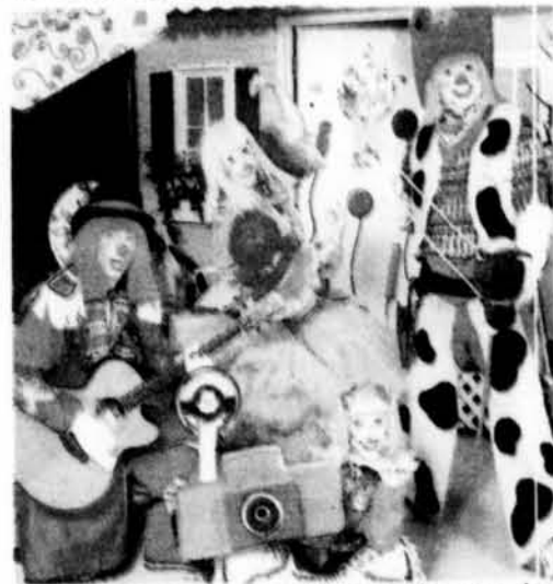
C'est toujours avec la même passion que les clowns Gibouléé, Tournesol, Igor Déor et Kabotine s'amuse avec les enfants lors de leurs spectacles. Ils seront d'ailleurs de passage le 20 juin prochain à la Maison de la culture.

Si le succès commercial et public commence à peine à frapper à la porte des Clowns du Carrousel, ces quatre joyeux lurons ont depuis belle lurette gagné le cœur de leur public cible, les enfants. De fait, chaque spectacle est l'occasion pour eux de voir en chair et en os, ces clowns qu'ils adorent et aussi l'occasion de fredonner et de danser au rythme de leurs plus grands succès musicaux. «Et il n'y a pas que les enfants qui chantent, on constate que même les parents connaissent nos chansons», ajoute le clown Gibouléé.