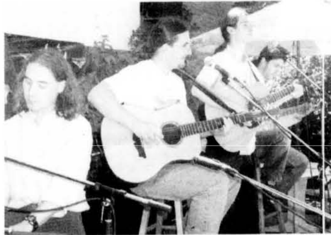
Le groupe Éveil, de Québec, rendra hommage à Harmonium, le 24 juin aux Concerts du Crépuscule.