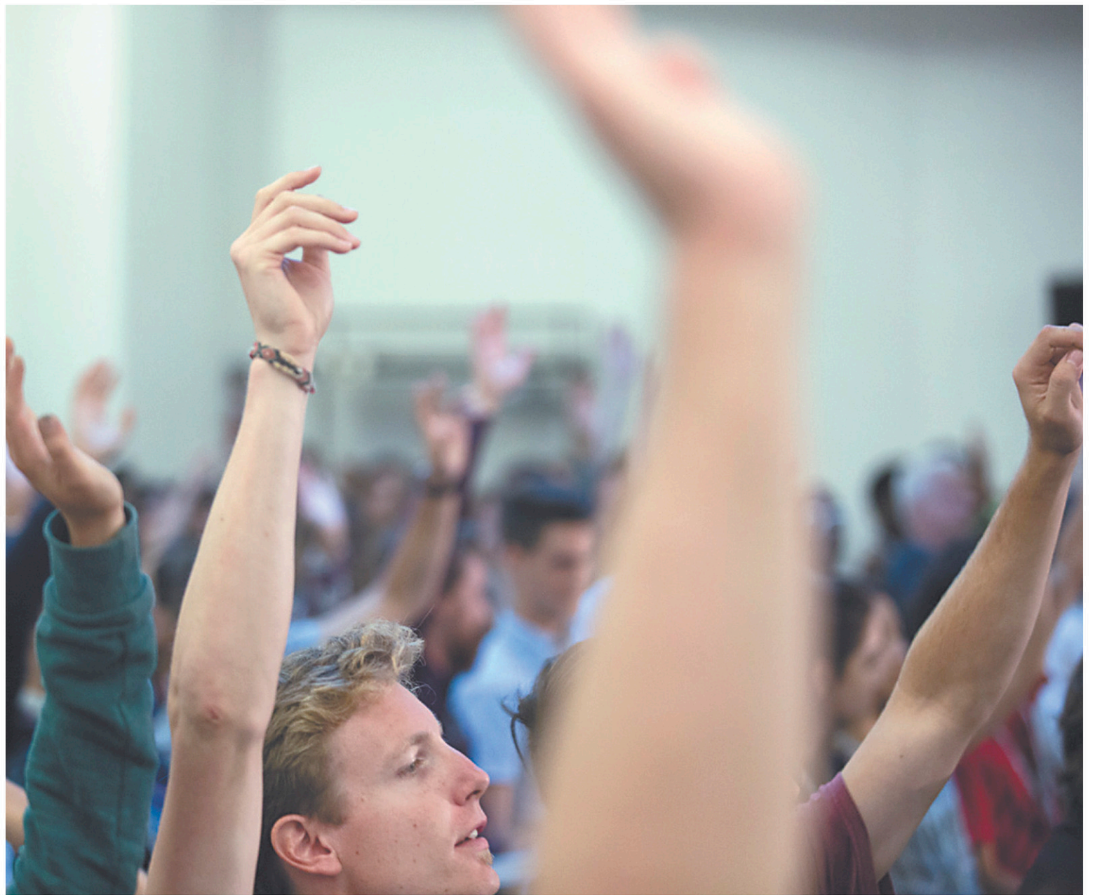
La participation citoyenne est en plein changement, au contact d'une multitude de facteurs.