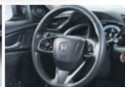
Volant gainé de cuir

CES CARACTÉRISTIQUES SONT INCLUSES SUR LE MODÈLE SE