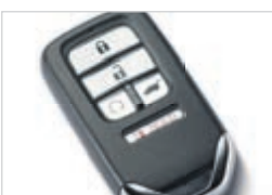
Démarrreur à distance