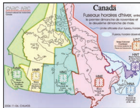
L'idée de rejoindre le fuseau horaire de l'Atlantique est relancée.

« C'est juste plus logique. Ça prend par exemple 6 heures de route de Gaspé pour se rendre à Edmunston dans un autre fuseau horaire, et ça en presque 30 pour aller à Thunder à l'autre bout complètement de l'Ontario, mais dans le même fuseau ... Je vois que ça commence à pagner et des politiciens sont embarqués là-dedans. C'est intéressant à voir et je veux regarder plus attentivement l'impact réel de tout ça sur les gens