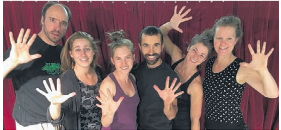
Un excellent spectacle éducatif avec des artistes de chez-nous.

«Nos jeunes ont besoin que nous les aidions. Ils ont besoin qu'on leur dise qu'il y a