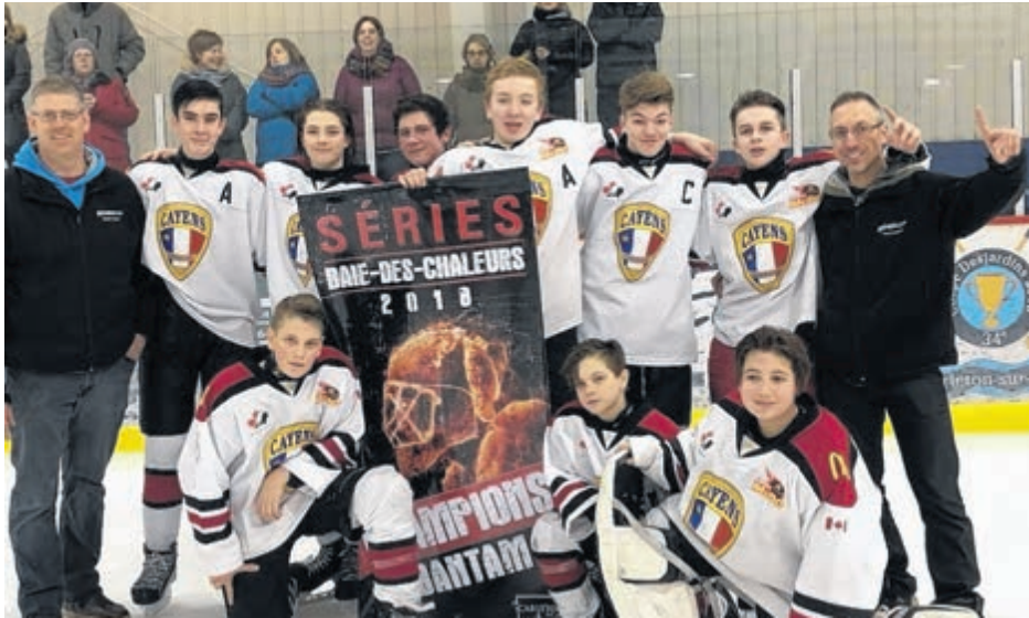
Dans le bantam, ce sont les Cayens de Bonaventure qui ont fait un maître face aux Légionnaires de New Richmond.

Les Vikings de Carleton-sur-Mer chez les pee-wee ont remporté la finale.