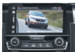
Technologies 1 de détection Honda Sensing MC