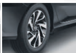
Roues de 16 po en alliage d'aluminium