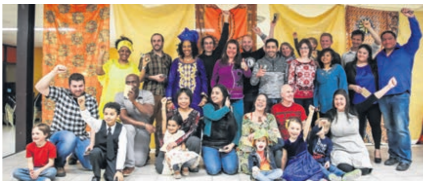
Profitez de ces quelques jours pour souligner cette belle diversité culturelle en Gaspésie.

Plusieurs activités seront organisées sur le territoire, dont le très populaire souper de la diversité culturelle, qui se tiendra le samedi 24 mars dans la majorité des MRC. Ce souper offre aux participants une expérience culinaire unique qui les fera voyager aux quatre coins du monde grâce aux talents des « chefs d'un soir » qui sont, pour la plupart, des personnes immigrantes