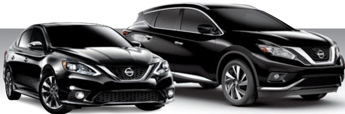
Sentra SR Turbo illustrée*