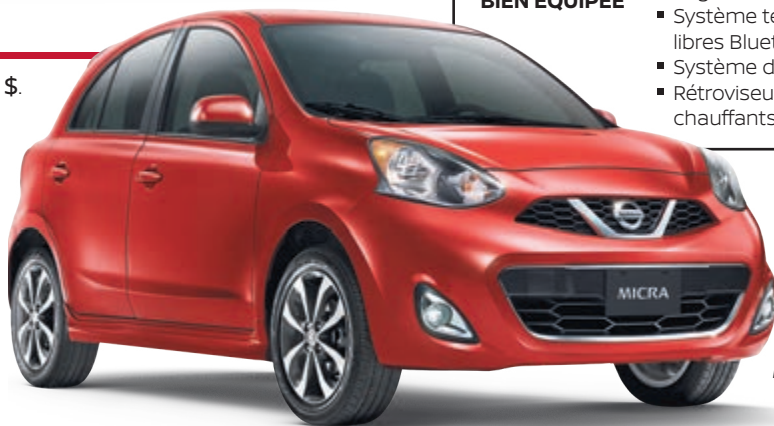
Micra SR illustrée*