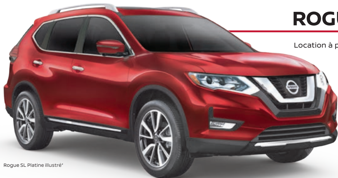
Rogue SL Platine illustré*