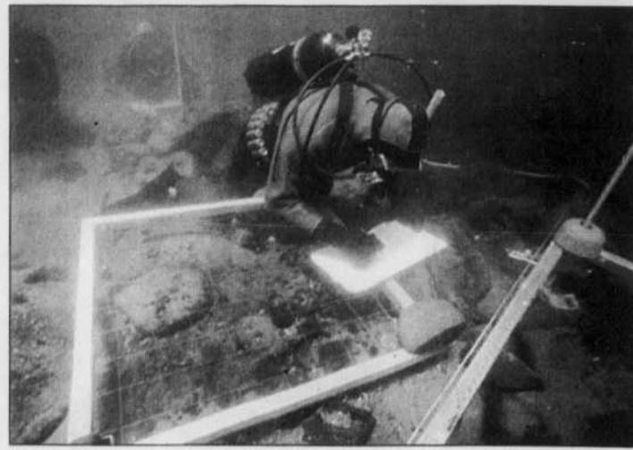
Un volontaire examine une partie de l'épave du Elizabeth and Mary , échoué près de la rive nord du Saint-Laurent.