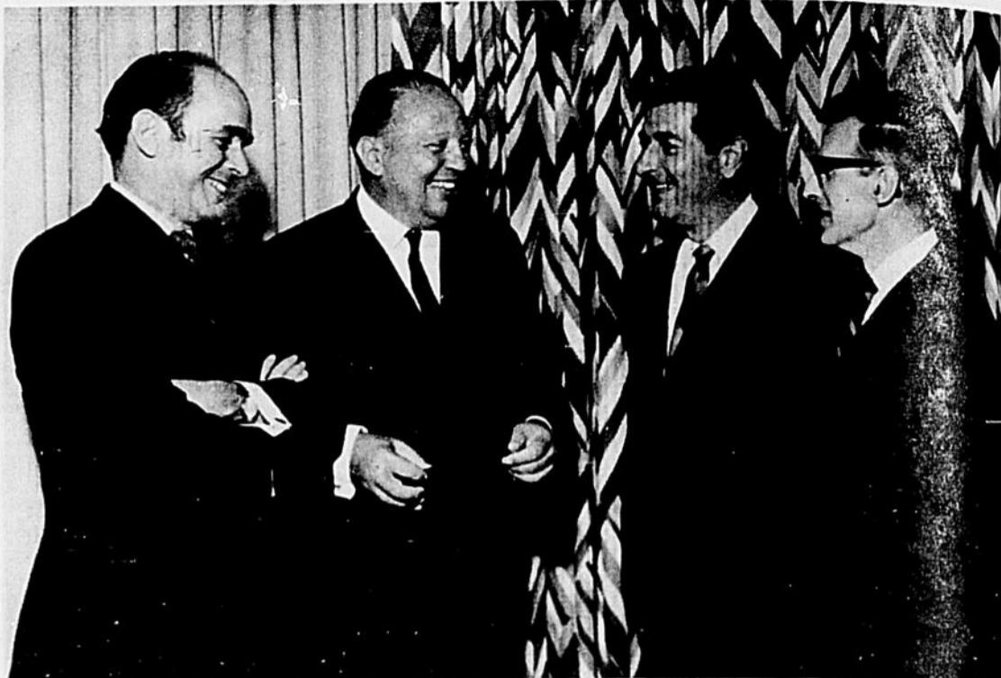
A l'issue de la réception qui marquait le lancement de l'ouvrage de Jean Sarrazin "De Mémoire d'Homme" et l'inauguration de la nouvelle politique de Radio-Canada dans le domaine de l'édition, on peut voir, réunis, de gauche à droite, sur notre photo: