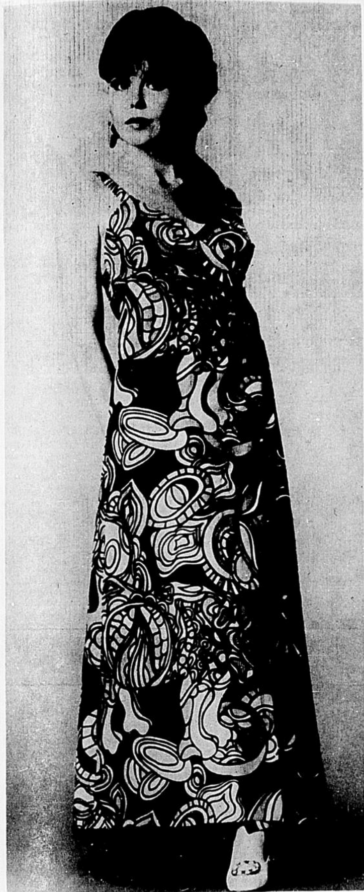
Une robe longue enveloppante, une vraie robe de soirée produite par Sterling Paper Fashions. Ces robes de papier imprimé sont pratiquement à l'épreuve du feu et non allergènes.