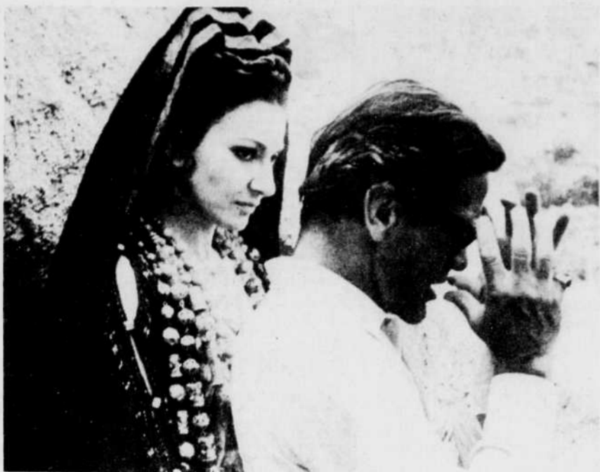
Maria Callas et le cinéaste italien Pier Paolo Pasolini pendant le tournage de "Médée" en 1970.

Callas est l'un des mythes de notre temps, au même titre que Marilyn Monroe ou Elvis Presley. Elle a bouleversé l'art lyrique. "Elle était la "diva".