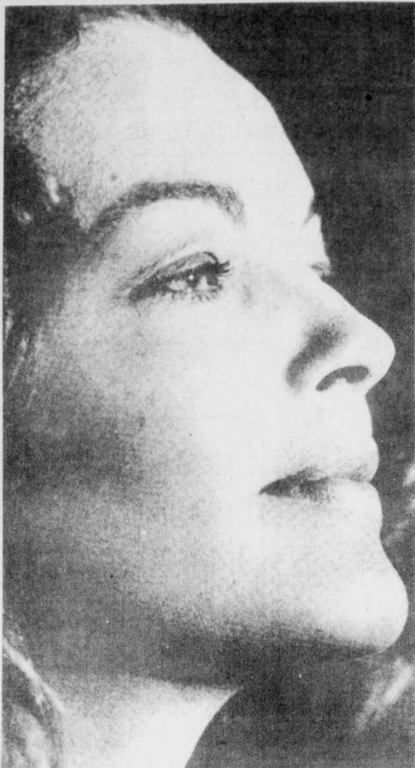
Le film... une sorte de testament artistique de la grande comédienne Romy Schneider.