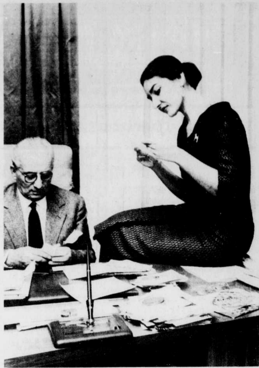
Maria Callas et son mari Giovanni Meneghini, qui lui sert brillamment d'impresario. Leur mariage avait eu lieu en 1949.

ma donna assoluta", chante "Le Trouvère". Maria Callas est belle, sculpturale dans son fourreau de velours rouge. La salle est silencieuse, attentive, respectueuse. "Cette femme, c'est un miracle..." Une dame blonde murmure ces mots en pleurant d'émotion. C'est une autre diva, la grande Elizabeth Schwarzkopf, qui vient d'exprimer cet hommage.