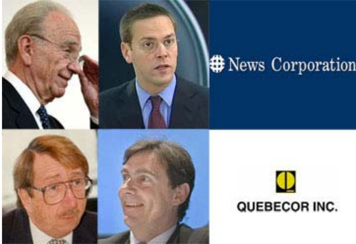
Rupert et James Murdoch (en haut)