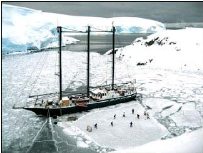
Partie de hockey entre les membres de l'équipage du Sedna IV