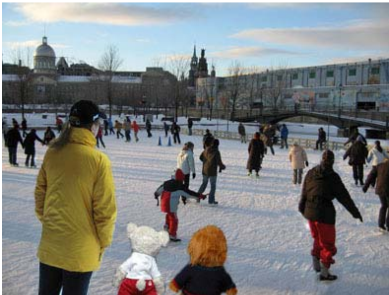
Mademoiselle X et les deux mascottes, Monsieur X et sa soeur Miss Gym, sur la patinoire extérieure du Vieux-Port de Montréal.

«En regardant en arrière, on court le risque de trébucher sur les obstacles qui se trouvent devant nous!»