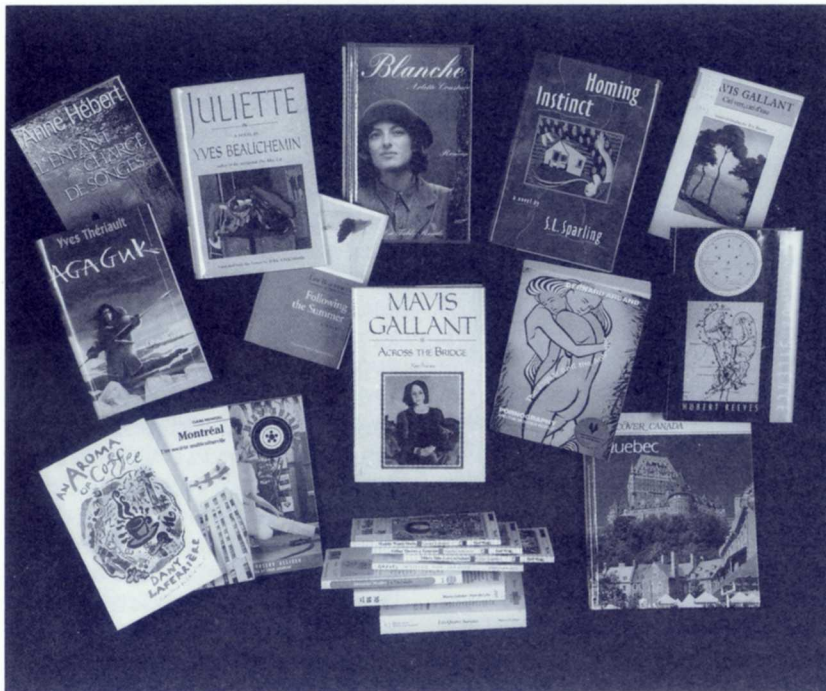
Quelques exemples d'auteurs québécois ayant attiré l'attention d'éditeurs étrangers.

Ceux qui soutiennent que la vitalité d'une littérature se mesure entre autres à son potention