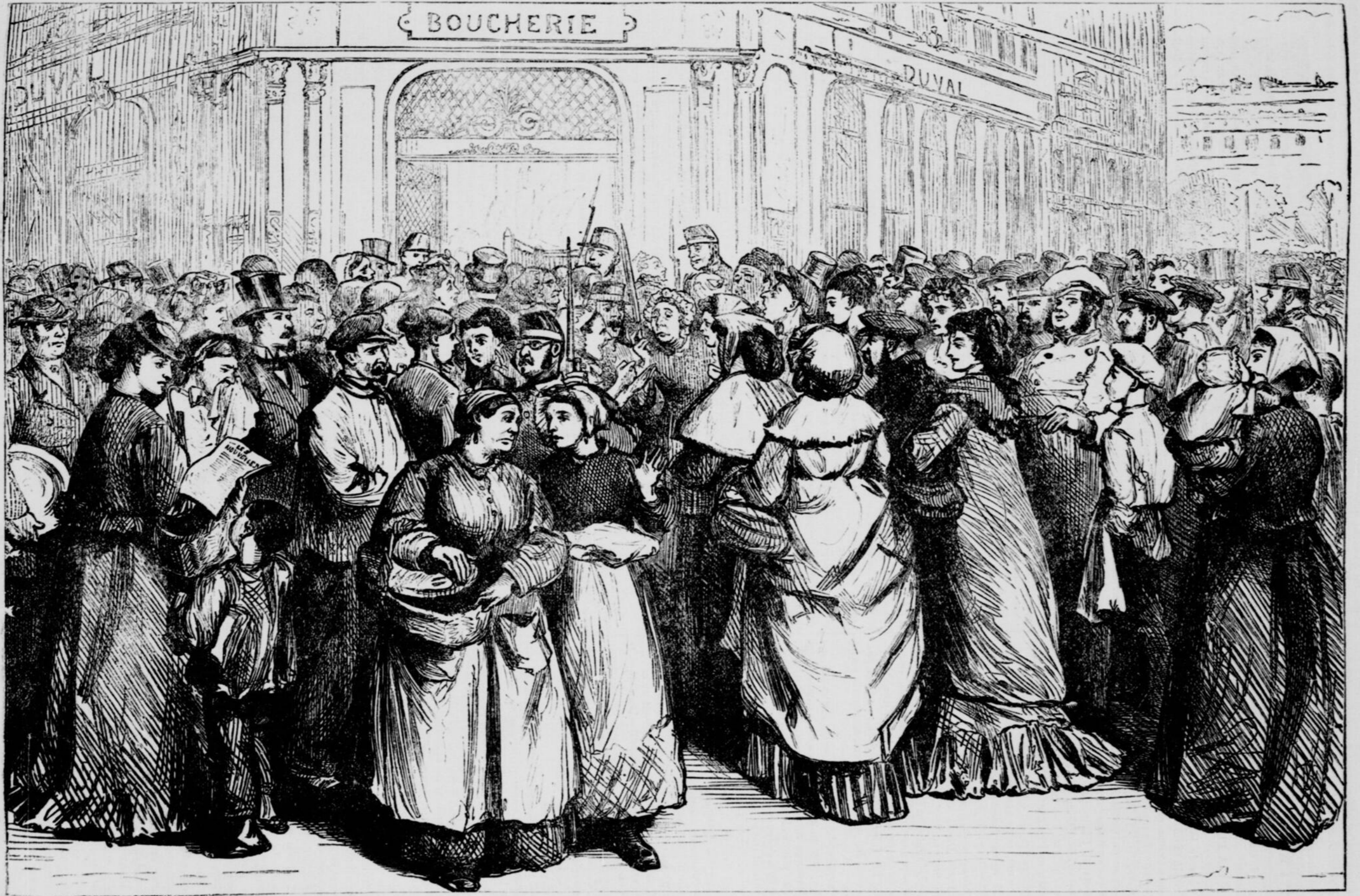
LE MARCHÉ AUX VIANDES, À PARIS.