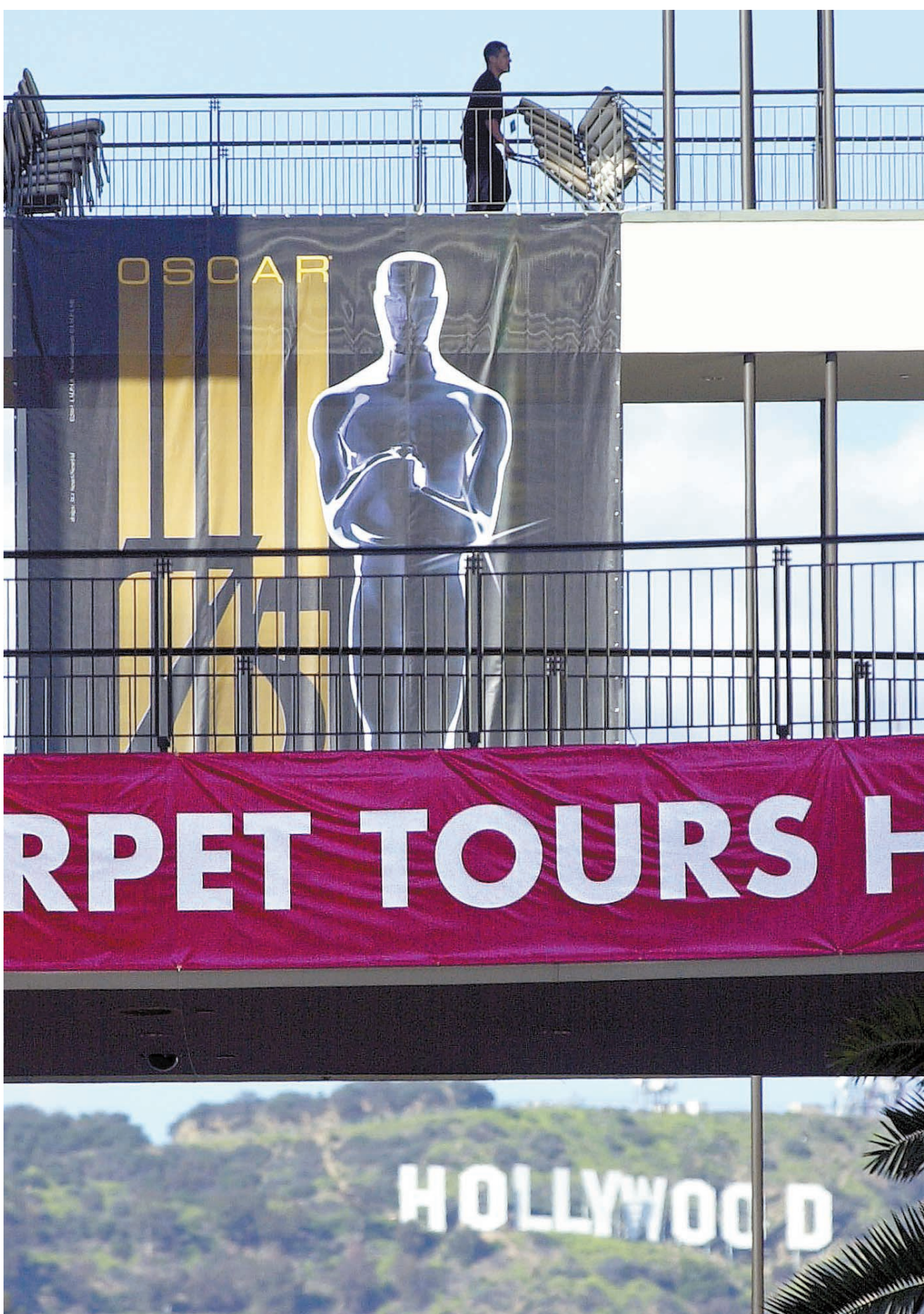
Les préparatifs allaient bon train hier, à Hollywood, à moins d'une semaine de la 75 e remise annuelle des Oscars. Et cela, malgré les menaces de guerre de plus en plus sérieuses.