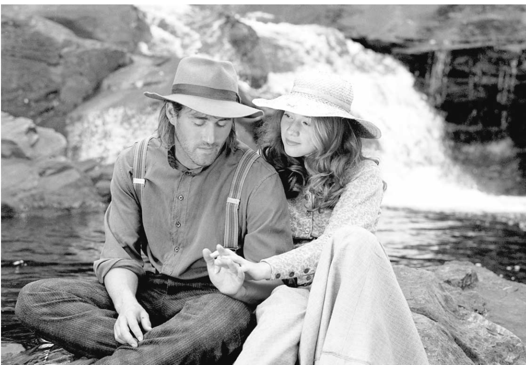
Même un film comme Séraphin met du temps à se rendre sur les écrans de l'Outaouais.

Un qui se frottait les mains à la vue de ces invités de marque qui ne ménageaient pas leurs louanges à son endroit, c'était Didier