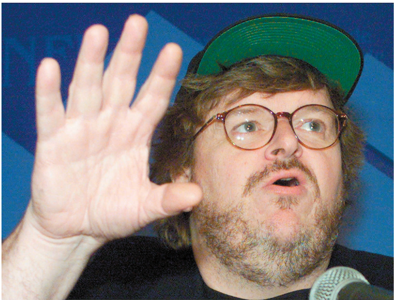
Celui par qui le scandale arrive (encore une fois) : Michael Moore.