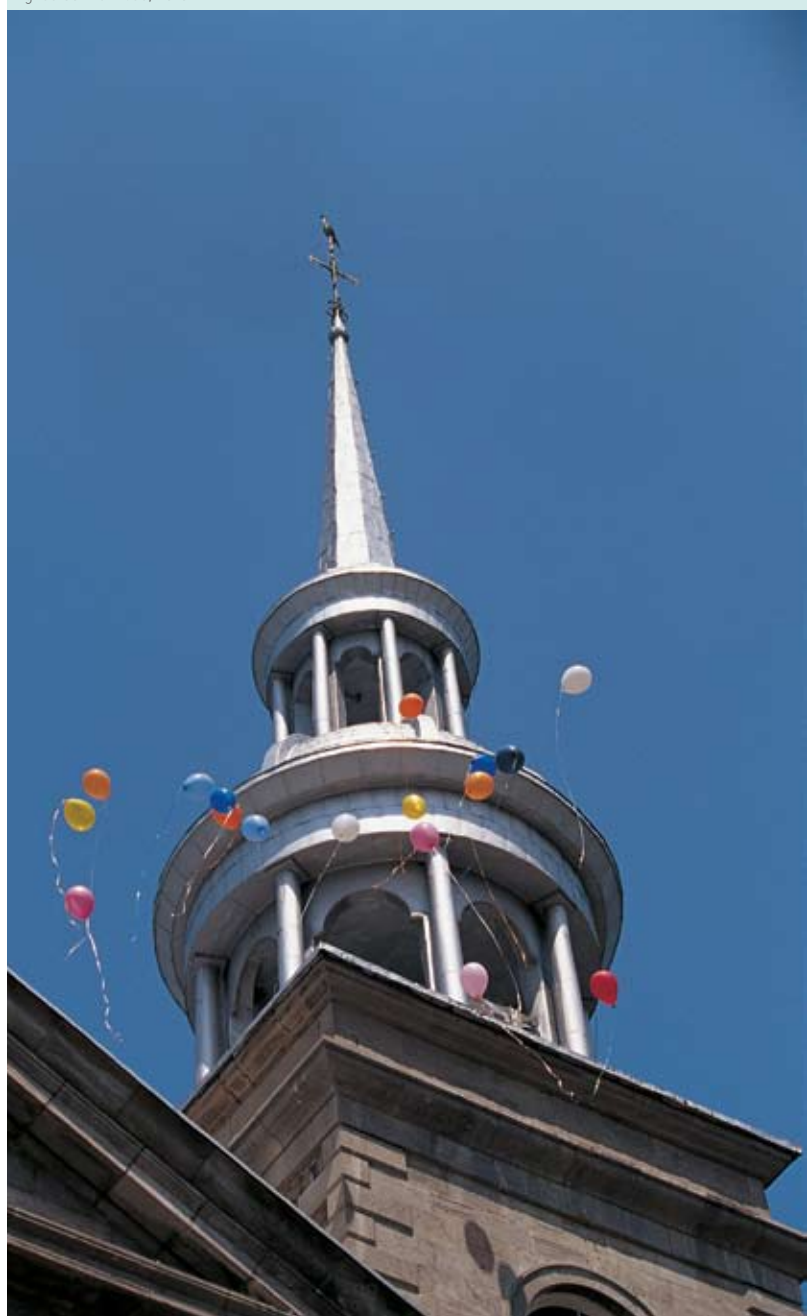
Église Sainte-Rose, Laval

L'Entente de développement culturel entre la Ville et le Ministère a fait l'objet d'une évaluation au cours de 2006 en vue d'un renouvellement qui a pris la forme d'une entente spécifique régionale, laquelle intègre de nouveaux partenaires.