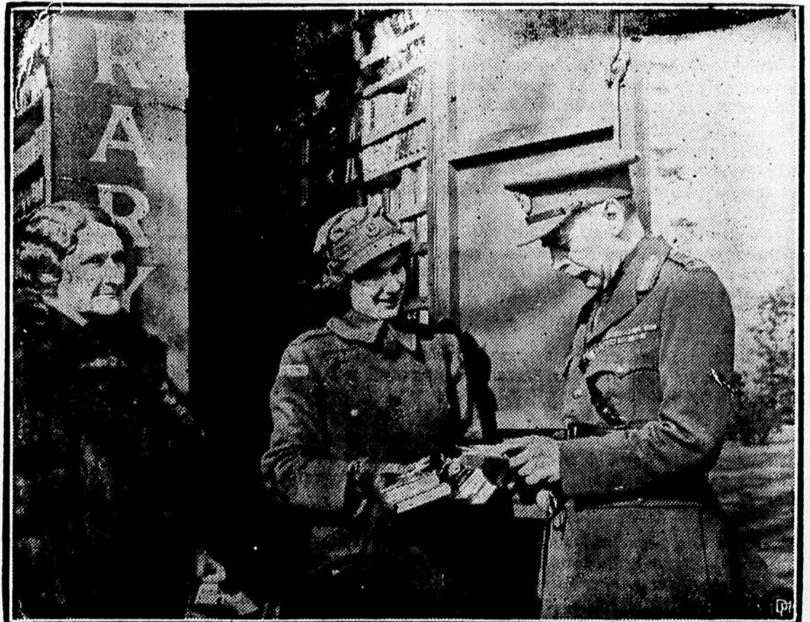
Le Major-Général McNAUGHTON, le premier soldat de l'armée canadienne, Commandant-en-chef de nos armées en Angleterre, s'entretient ici avec un groupe de jeunes anglaises

qui font partie des forces auxiliaires de l'armée de terre et qui donnent leur temps pour la défense de leur pays.