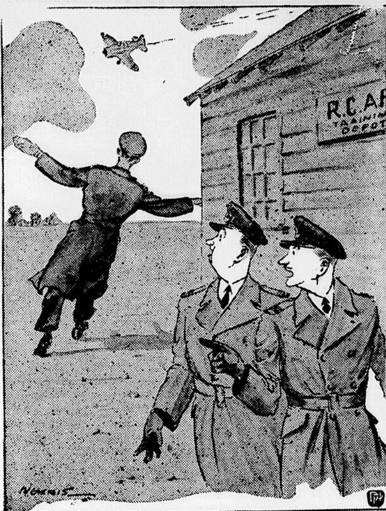
"Ne crois-tu pas que nous entraînon nos hommes un peu trop?"