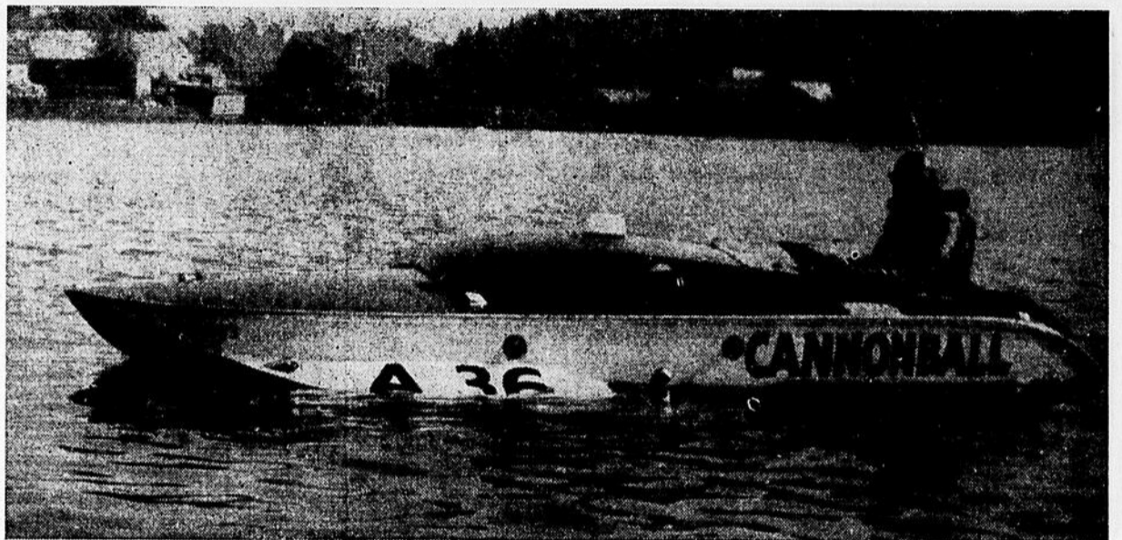
FRANK BAKER de Saranac Lake, qui détient le record mondial de 68.8 milles à l'heure, gagné à Miami, Floride, dans les courses de yacht, sera présent aux régates de Valleyfield, les 26 et 27 juillet prochains, avec son "Cannonball".