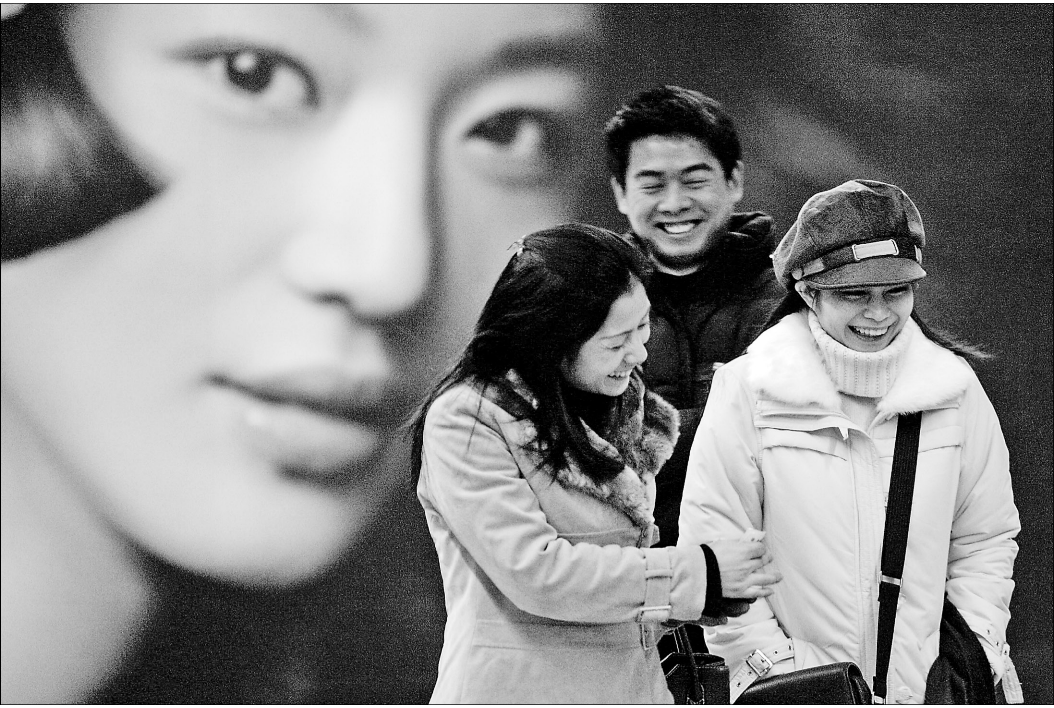
Shopping entre amis à Pékin. C'est souvent lors des séances de magasinage qu'on peut observer les concubines et leurs riches amants.