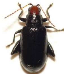
Photo : Altise

Altise à tête rouge : Cette semaine, on nous mentionne une forte activité d'altises dans certains champs. L'adulte est un petit coléoptère noir luisant d'une longueur variant de 3,0 à 6,3 mm. En regardant attentivement, une tache rougeâtre est visible sur la tête de l'insecte. Les antennes font environ la moitié de la longueur du corps de l'insecte. Les pattes postérieures, bien développées et semblables à celles d'une sauterelle, permettent à l'insecte de faire des sauts impressionnants. Les altises sont également capables de voler.