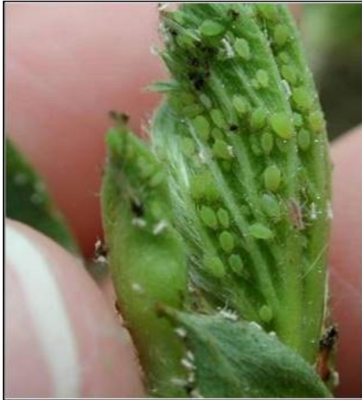
Photo 1 : Colonies de pucerons du fraisier sur jeunes feuilles

Puceron du fraisier : On nous mentionne actuellement, dans certaines régions, la présence de larves du puceron du fraisier (surtout les stades 3 et 4), ainsi que des premiers adultes. C'est sur les larves de stade 4, que l'on peut voir apparaître des ébauches d'ailes appelées « bourgeons alaires » (photo 2). Certaines colonies de pucerons sont aussi observées sur les feuilles dans le cœur des plants (photo 1). Sur certains sites, ces colonies possèdent des larves de stade 1; il y a donc début de parthénogenèse des femelles adultes (deuxième génération). Assurez-vous de bien identifier le type de puceron présent, car plusieurs types de pucerons sont actuellement observés dans les colonies. Le puceron du fraisier se distingue bien des autres pucerons, car tout son corps est recouvert de soies courtes aux extrémités renflées. Les pièges jaunes collants ont été installés dans plusieurs champs afin d'observer l'arrivée des premiers pucerons ailés qui sont le stade critique d'intervention contre ce vecteur de virus.