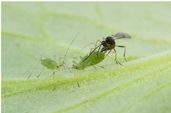
Photo 3: Guêpe prédatrice Aphidius pondant dans un puceron

Fait intéressant, on nous mentionne aussi la présence de guêpes prédatrices (photo 3) de pucerons dans certains champs. Ces guêpes prédatrices ( Aphidius ) pondent dans les pucerons et ces derniers se trouvent ainsi momifiés (photo 4) lorsque la larve s'y développe.