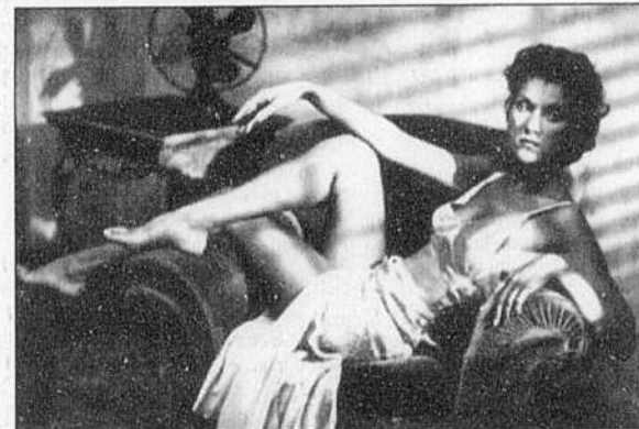
Céline Dion, vedette internationale.

Un reportage sur Céline Dion. Nous la voyons à Los Angeles, à Montréal, à Vancouver. Nous la voyons à la télévision, chez sa maman, aux côtés de Jay Leno... Radio-Canada, 22h25