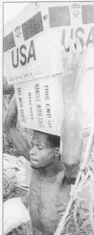
Transport de vivres de secours dans un camp du Zaïre.