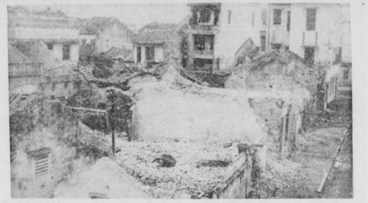
Cette photographie montre un quartier de Hanoi après un bombardement effectué à la mi-décembre par l'aviation américaine. Les autorités de Washington avaient tout d'abord affirmé que la capitale du Nord-Vietnam n'avait jamais été atteinte. Par la suite, devant de nombreux témoignages dont celui d'un journaliste du «New York Times», M. Harrison Salisbury, le porte-parole du président Johnson avait reconnu que les bombes et des fusées avaient pu tomber sur Hanoi, causant des pertes humaines dans la population civile.