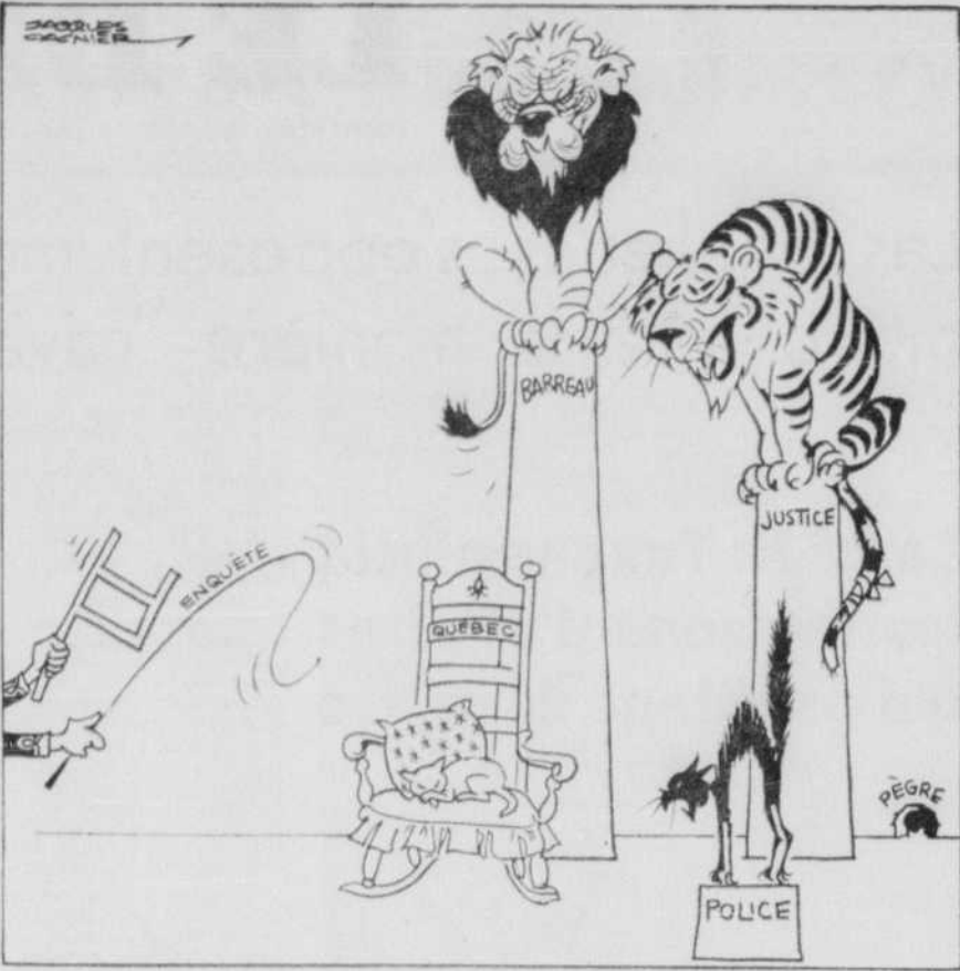
L'art d'attraper un rat avec une chaise

On dira que si ces "administrateurs" abusent de leurs pouvoirs pour dénoncer fausement ou injustement des confrères, il n'est que juste qu'on puisse les punir, à leur tour. C'est un argument qui ne vaut guère.