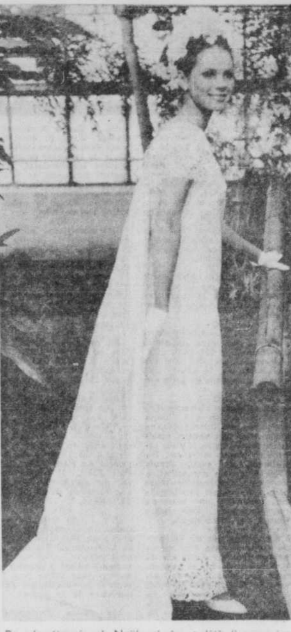
Pour les fiancées de Noël qui rêvent déjà d'un mariage en juin, Portrait, manufacturier spécialiste des toilettes de mariée vous suggère cette élégante robe rehaussée de guipure. Le corsage en dentelle à motif de fleurs découpe en rond l'encolure dans le dos qui se termine sur une boucle attachant la longue traîne. Pas de voile mais un bonnet de fleurs.