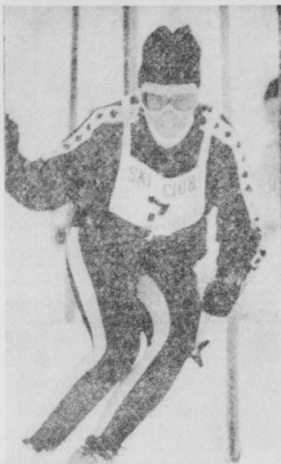
Ce qu'on savait déjà, la jeune Canadienne Nancy Greene l'a confirmé avec éclat, en fin de semaine à Oberstaufen, Allemagne de l'Ouest. Elle a confirmé sa grande classe chez les skieuses du monde entier, en enlevant la coupe Staufen, au nez de ses plus grandes rivales, Annie Famosé et Fernande Bochaty. Sur la vignette, Mlle Greene est à compléter son triomphe dans le combiné.