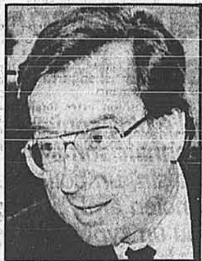
M. Bourassa a dit qu'il fallait tenir compte de la situation explosive sur le territoire des Mohawks.

Deux types de cigarettes étaient vendus illégalement sur la réserve, a-t-il rappelé. Les premières n'étaient pas taxées parce qu'elles étaient destinées au marché américain. «La-dessus on ne peut pas bouger c'est de la contrebande», a lancé le ministre.