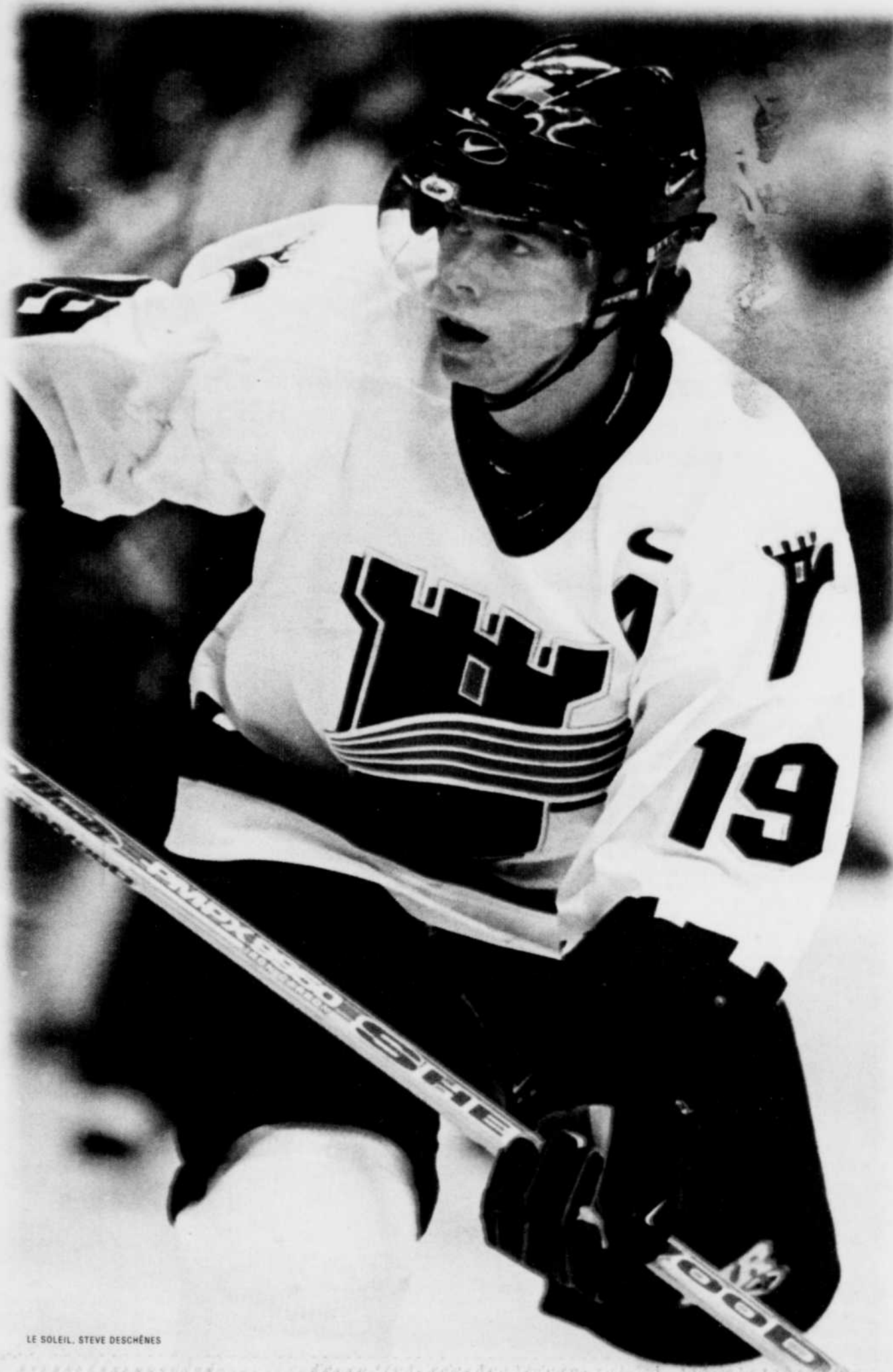
LE SOLEIL, STEVE DESCHÈNES