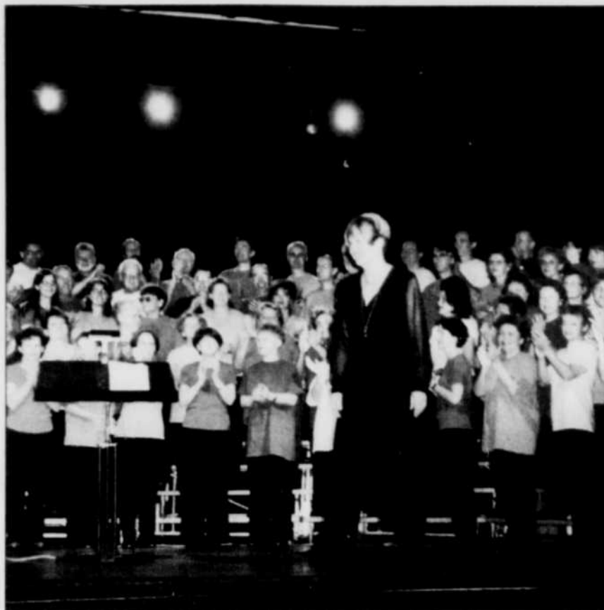
Près de 100 choristes et musiciens seront réunis sur une même scène, tout comme à l'ouverture du Festi-Jazz de Rimouski, en août

« On pourrait dire que c'est de l'autopromotion éhontée », admet-il, notant que l'épisode a été diffusé le lendemain de la sortie de Spy Game . « Mais de l'autre côté, c'est travailler avec ma femme, ce que je voulais faire. Et travailler sur cette série qui a une incroyable capacité à vous rendre tout simplement heureux. » En outre, « je crois que le rire est très important en ce moment ».