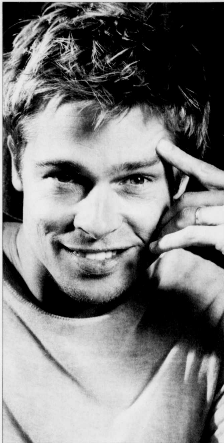
Brad Pitt est harcelé par les paparazzi et par les « fans ».

Même son partenaire dans Ocean Eleven de Steven Soderbergh,