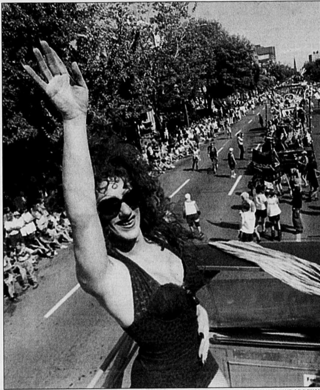
Des dizaines de milliers de personnes ont passé tout l'après-midi rue Saint-Denis pour assister ou participer au défilé de la Fierté.