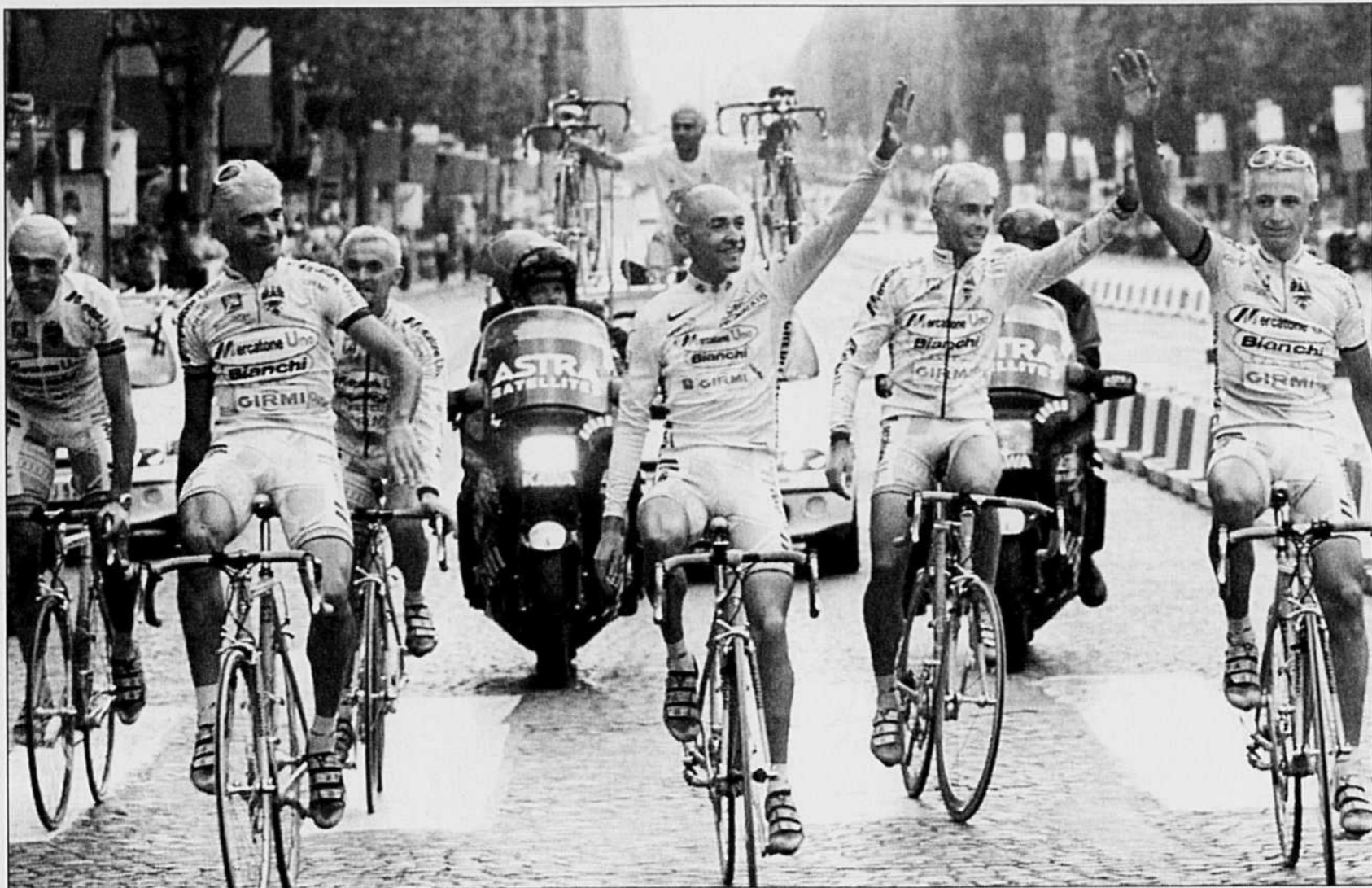
Marco Pantani, au centre, remontant hier les Champs-Élysées: «Marco Magno, le dernier empereur, le plus grand.»

Villeneuve a conclu en déclarant qu'il était ravi d'avoir pu devancer Michael Schumacher — cinquième — sur le circuit allemand: «Je suis assez content parce que tout au long de la saison, Michael a été très compétitif surtout sur les circuits où il y a beaucoup d'accélération à partir de basses vitesses et comme il y en a beaucoup sur ce circuit, j'avais des doutes avant de venir ici. Mais le battre chez lui, ça fait plaisir.»