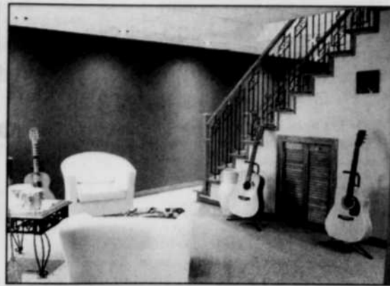
Les propriétaires ont opté pour un éclairage général en périmètre de la pièce, mettant en valeur la teinte marron des murs.