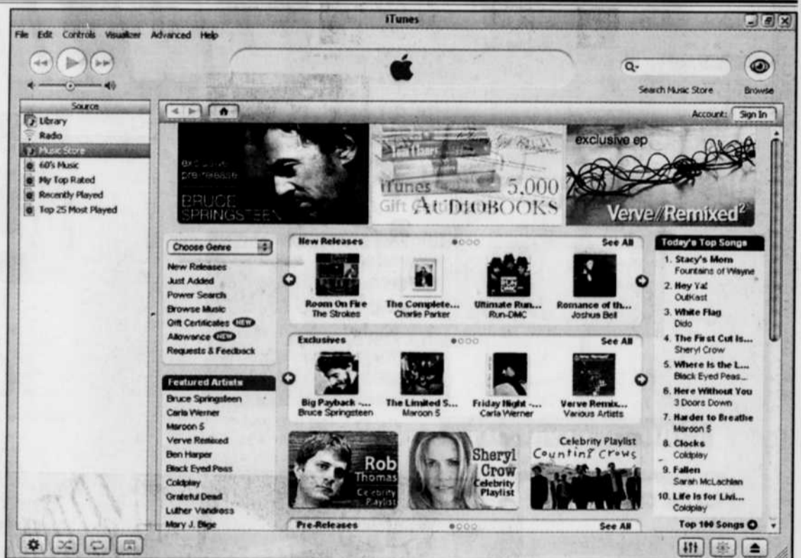
L'interface principale de iTunes 4.0 est un modèle de simplicité et d'élégance. On peut accéder directement à la page d'accueil du magasin en ligne iTunes Music Store.

La version Windows de iTunes 4.0 se distingue déjà comme le meilleur outil de gestion des fichiers musicaux numériques. Son interface simple et fonctionnelle fait contraste avec la présentation chargée de «bébélles» du Windows Media Player, de Microsoft. La confection de listes d'écoute est un jeu d'enfant, tout comme le classement des chansons par catégories. On accède directement au magasin en ligne d'Apple à partir de l'interface principale. Mais il y a plus: iTunes donne accès directement à 250 stations de radio gratuites sur Internet, dans tous les genres, et permet de graver directement les chansons sur un nombre illimité de cédérom ou de DVD pour usage personnel. Les termes de l'accord d'utilisation des chansons permettent aussi de les partager en réseau entre trois ordinateurs.