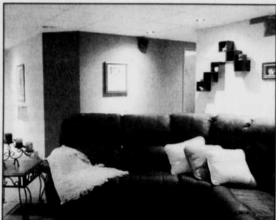
Pour un effet théâtral: éclairage d'accentuation des tableaux et accessoires à l'aide d'ampoules par 20 à faisceau étroit.

L'éclairage d'accentuation : c'est avec ce type d'éclairage que l'on pourra donner une ambiance à notre pièce. Effet théâtral obtenu par un projecteur encastré rehaussant un détail architec-