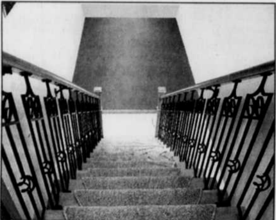
Recouvrement partiel des marches d'escalier permettant de conserver la chaleur du bois. Fonction et confort font bon ménage.