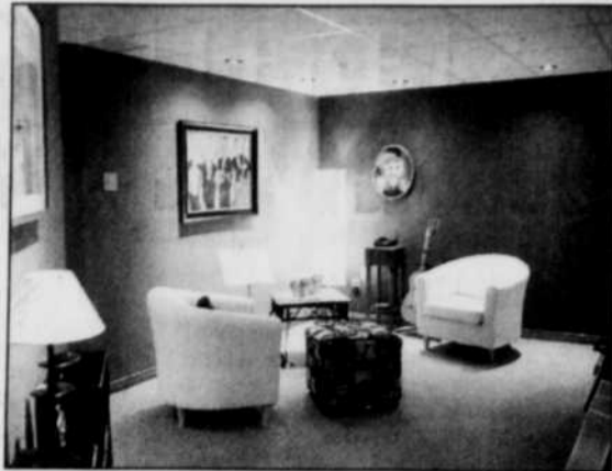
Lampe d'appoint complétant l'éclairage général ambiant, pour les soirées musicales...

L'éclairage de tâche : éclairage dédié à la lecture, la couture, le travail de bureau ou ordinateur, toute autre tâche prévue par les occupants. Obtenir par la disposition des différents appareils d'appoint tel que lampes de lecture ou de travail, projecteurs intégrés au mobilier pour l'utilisation du système audio, il est responsable du confort des utilisateurs lors de l'accomplissement de leurs tâches. Il deviendra donc l'éclairage le plus utile, d'où l'importance d'une bonne analyse de ses besoins au départ. Attention aux projecteurs encastrés et aux rails d'éclairage disposés au centre de la pièce, ceux-ci projettent un éclairage quelque peu agressant et limitent le mouvement du mobilier.