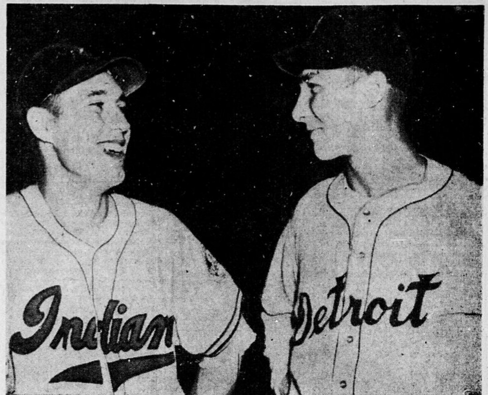
BOB FELLER (gauche), lanceur-étoile des Indiens de Cleveland, et HAL NEWHOUSER, la vedette des Tigers de Detroit, sont tous souriants quand ils se rencontrent avant une joute entre les Indiens et les Tigers, à Cleveland. Les deux artilleurs sont engagés dans une grande lutte cette saison. Ils tentent de totaliser 30 victoires. Feller manqua de justesse sa 22e victoire et Newhouser en a 20 à son crédit. Il y a douze ans qu'on n'a pas vu un lanceur enregistrer 30 victoires dans les majeures. Cette année, il est possible qu'il y en ait deux.

EMPLOYEZ SKEETER SKATTER IL EST NOUVEAU ET ENCORE PLUS EFFICACE LÉGÈREMENT PARFUMÉ IL N'EST PAS GLUANT NE TACHE PAS N'IRRITE PAS MOUCHES NOIRES, MOUSTIQUES