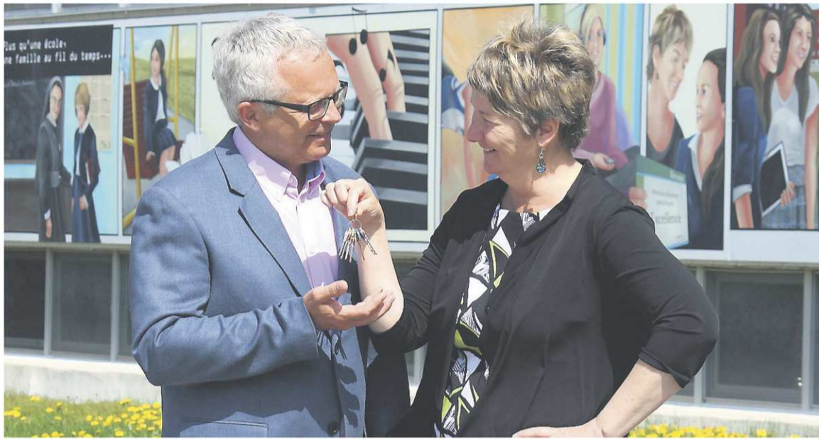
LA TRIBUNE, MARYSE CARBONNEAU

« Je crois que d'apporter une nouvelle énergie et de nouvelles idées peut être profitable autant pour la direction que pour