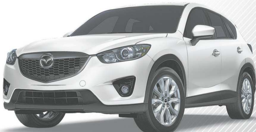
Modèle Mazda CX-5 GT illustré

CONSULTEZ LE MAZDA.CA POUR TOUS LES DÉTAILS.