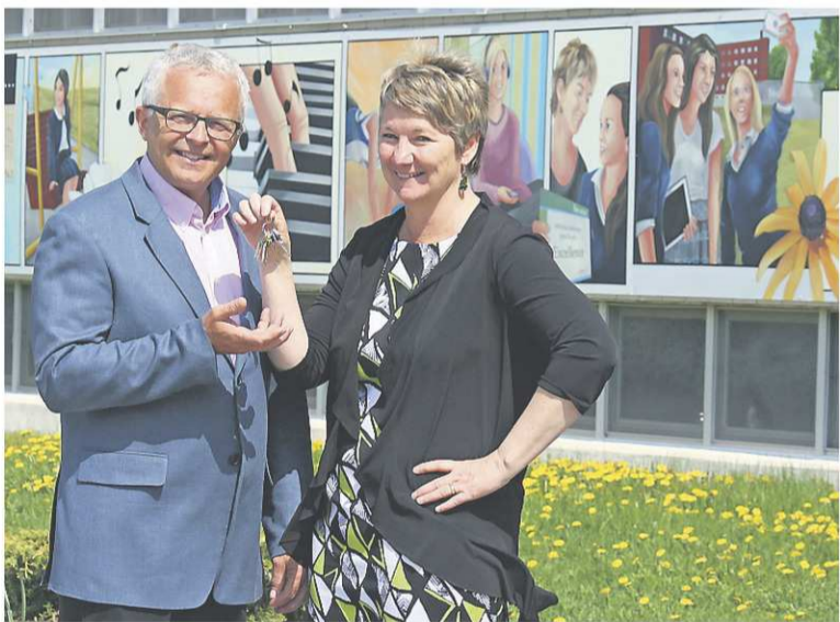
LA TRIBUNE, MARYSE CARBONNEAU

COLLÈGE FRANÇOIS-DEPLACE PASSER LA MAIN À SON CONJOINT