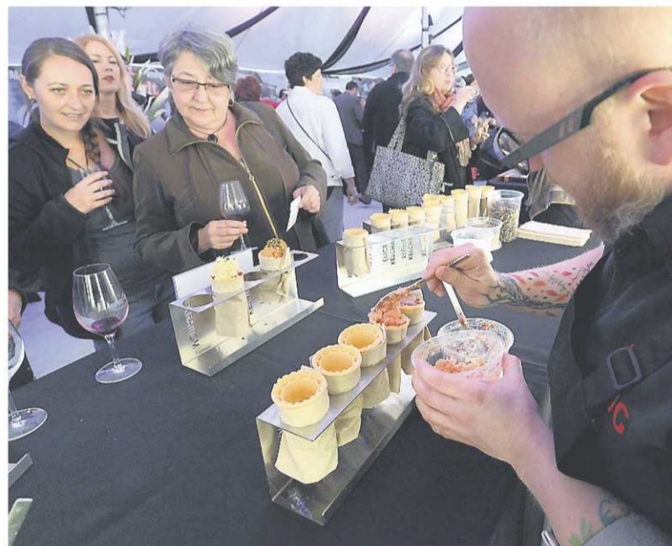
IMACOM, MAXIME PICARD