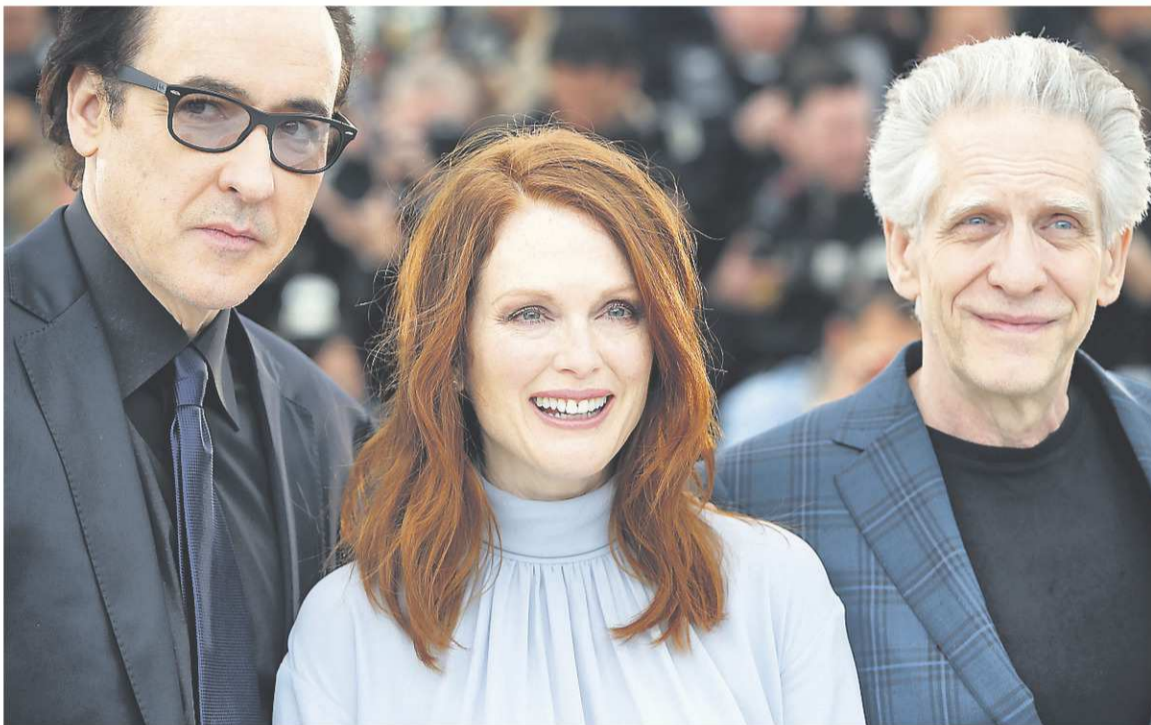
John Cusack et Julianne Moore accompagnent le réalisateur David Cronenberg pour la présentation officielle de Maps of the Stars , hier, à Cannes.

Le thème de l'inceste y est présent littéralement, dans la relation étrange que développe