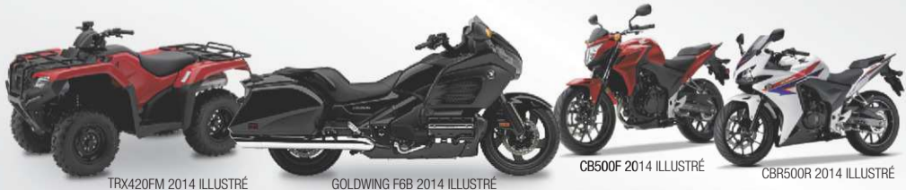
TRX420FM 2014 ILLUSTRÉ

DES PRODUITS UNIQUES, DES HEURES ET DES KILOMÈTRES DE PLAISIR!