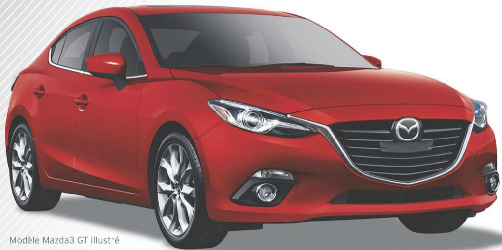
Modèle Mazda3 GT illustré