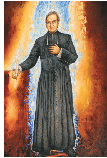
Un portrait du père Cestac

Téléphone : 514 985-3322 Télécopieur : 514 985-3340