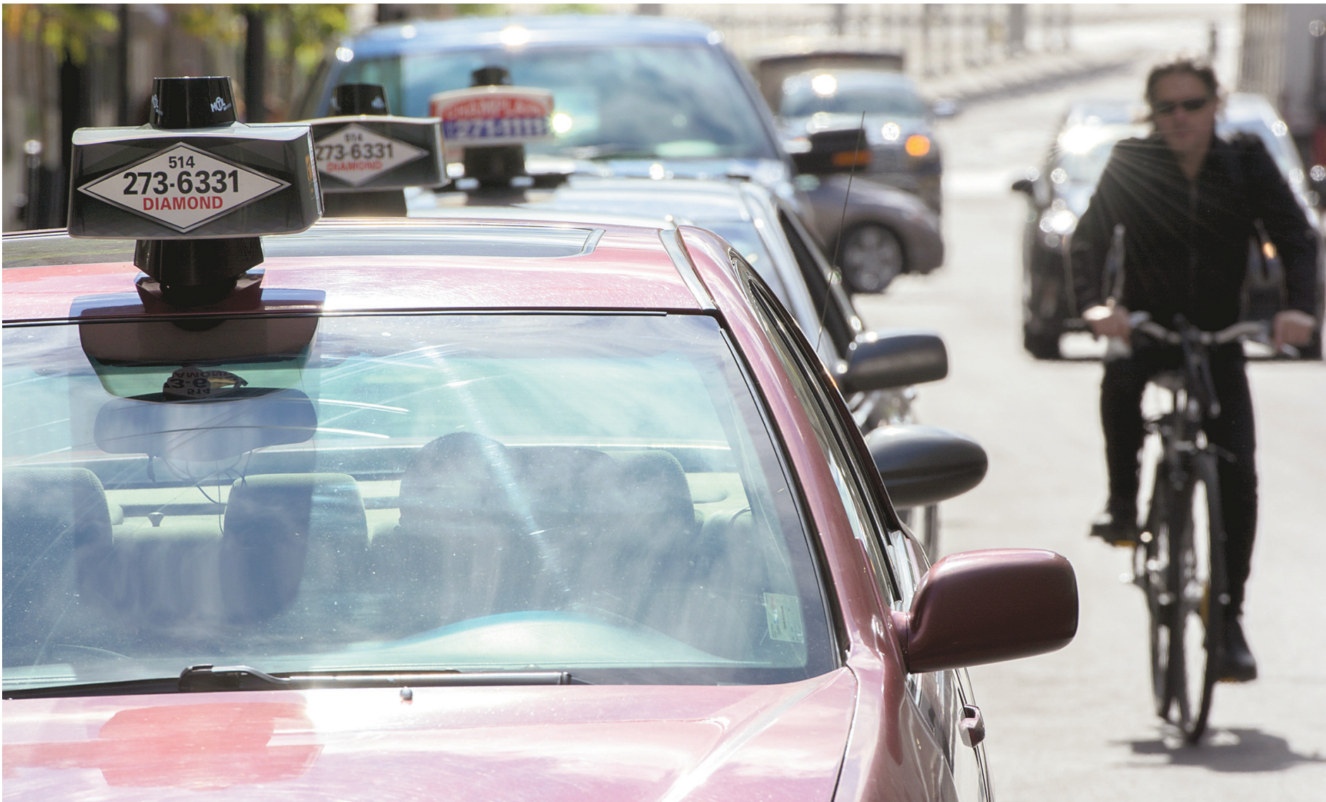
MICHAËL MONNIER LE DEVOIR

Devant la concurrence féroce d'Uber, l'industrie du taxi montréalaise veut se servir de ses statistiques pour améliorer son service.