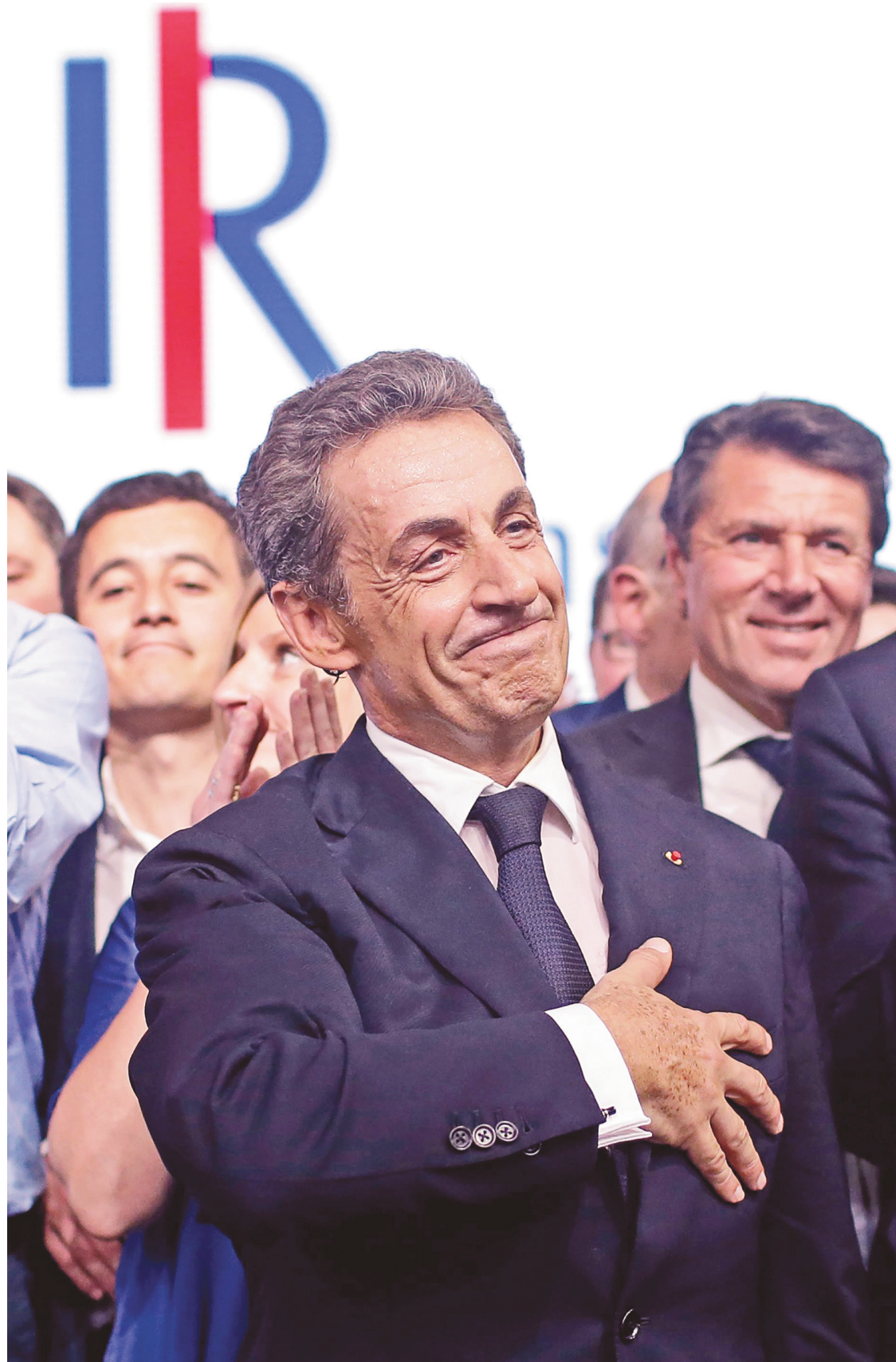
Samedi, l'ancien président français Nicolas Sarkozy a pris la parole devant les membres de son parti, qui a adopté un nouveau nom et une nouvelle équipe en vue de la présidentielle de 2017.