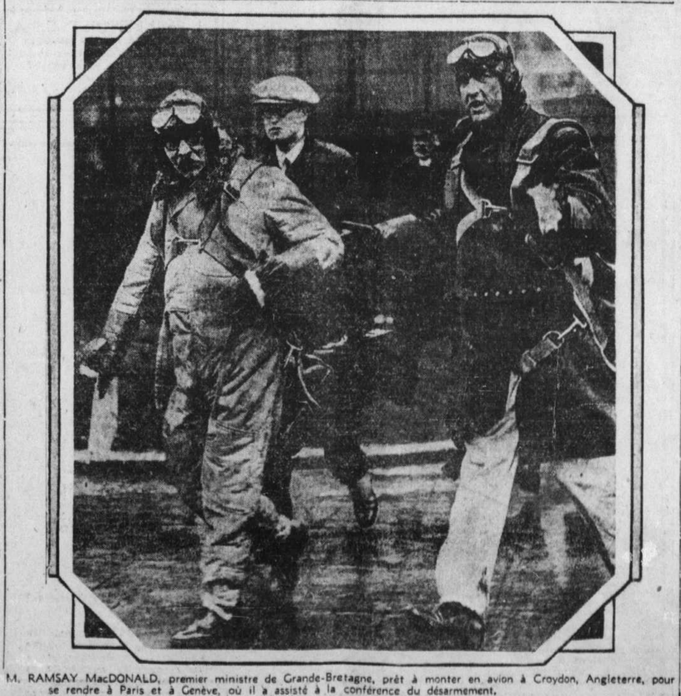
M. RAMSAY MacDONALD, premier ministre de Grande-Bretagne, prêt à monter en avion à Croydon, Angleterre, pour se rendre à Paris et à Genève, où il a assisté à la conférence du désarmement.

(13) The Gazette , Montréal, 2 avril 1932. (14) M. de Belmont, op. cit., pp. 10-11. (15) The Gazette (Montréal), 2 avril 1932. (16) E.-Z. Massicotte, Dollard des Ormeaux et ses compagnons... (Montréal 1920), p. 9. (17) Lettres de la Revérende Mère Marie de l'Incarnation , op. cit., p. 154.