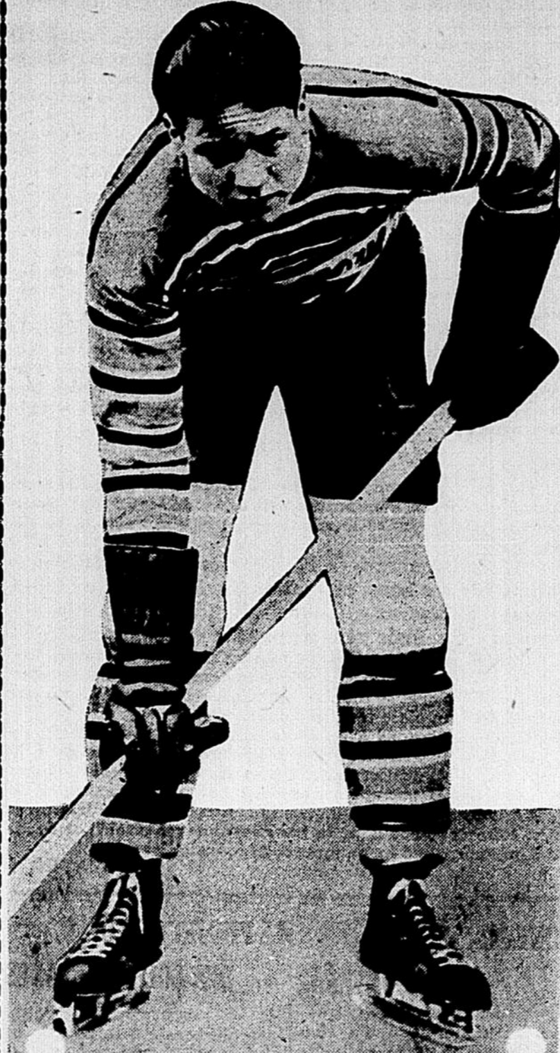
Ce joueur de défense du Toronto est de tous les joueurs de la Ligue celui qui a passé le plus de temps en pénitence et qui a 'descendu' Eddie Shore d'un formidable coup de poing.