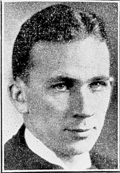
REAL LANTHIER

Du vingt-six au vingt neuf décembre dernier, la Fédération Nationale des Etudiants des