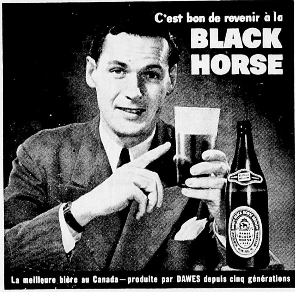
La meilleure bière au Canada — produite par DAWES depuis cinq générations