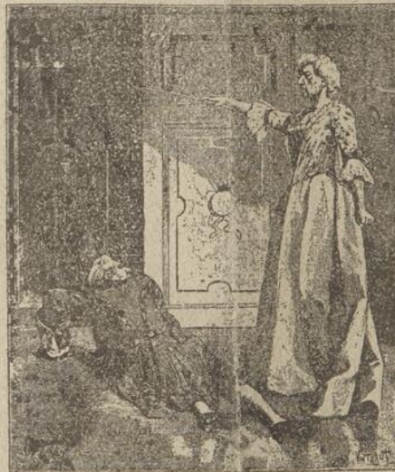
Et l'homme terrassé, tout épuisé, se traîne péniblement vers la cage, page 2, col. 1.

Contient les plus beaux ro- mans du jour; magnifiques illus- trations. Huit pages UN SOU