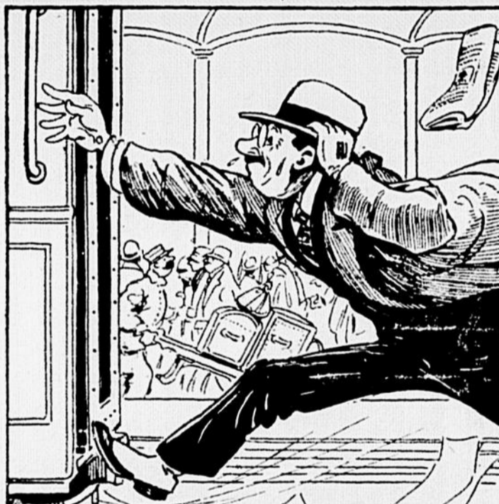
TAS PAS DÉJÀ PRIS UN TRAIN À LA HÂTE, RÉUSSIS À TROUVER UN SIÈGE