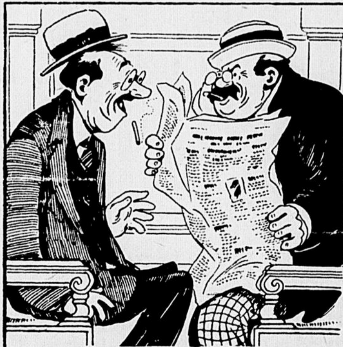
TOUT D'UN COUP QUE TON VOISIN TE DEMANDE D'UN TON SARCASQUE SI TU ACHÈVE, POUR QU'IL PUISSE TOURNER LA PAGE