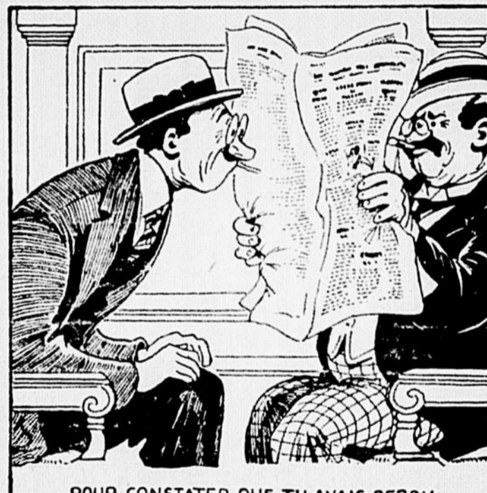
POUR CONSTATER QUE TU AVAIS PERDU TON JOURNAL, DE TE CASSER LE COU POUR LIRE CELUI DE TON VOISIN, EN ARRACHER POUR ATTRAPER LA DERNIÈRE LIGNE-