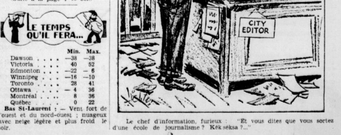
Le chef d'information, furieux: "Et vous dites que vous sortez d'une école de journalisme? Kek sekka?..."