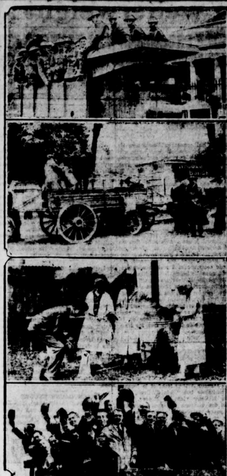
Quelques scènes durant la dernière grève en Angleterre. En haut, un camion chargé de soldats sur le Hyde Park. Un peu plus bas, une provision de lait qu'on décharge à un magasin du Hyde Park. Des cuisiniers volontaires préparant le repas des employés volontaires. En bas, un groupe de volontaires arrivant sur un camion. Parmi eux, on remarque des étudiants et des jeunes gens de toutes les classes, riches comme pauvres.

Supposons l'exterritorialité supprimée, les écoles n'auraient eu qu'à se soumettre, c'est-à-dire à cesser d'être chrétiennes ou à se fermer. Voilà pourquoi l'immense majorité des missionnaires catholiques et protestants, tout en admettant qu'un réforme certains abus auxquels l'exterritorialité a donné naissance (en particulier le régime des écoles mixtes et des tribunaux consulaires), désirent que l'exterritorialité soit maintenue jusqu'à ce que la Chine soit parvenue à une certaine mesure de la liberté et la sécurité de son territoire. J. S.