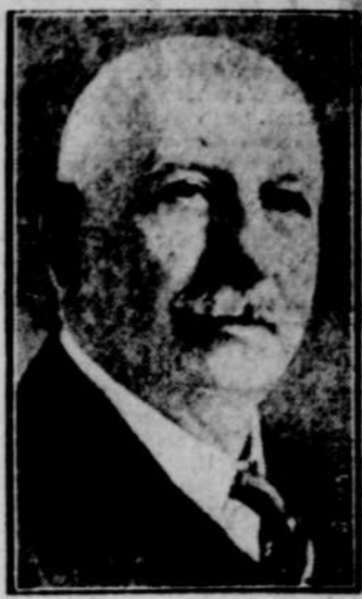
E. K. SPINNEY, l'ancien ministre sans portefeuille du cabinet Meighen, qui est mort à Boston ces jours derniers.

Venez aujourd'hui à la MAISON LOUIS 30 RUE DES FORGES (EN FACE DU MARCHE) LES TROIS-RIVIERES