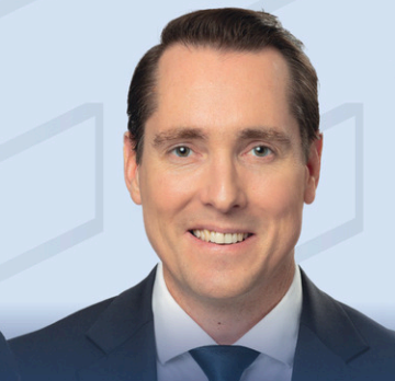
SIMON ALLAIRE Député de Maskinongé