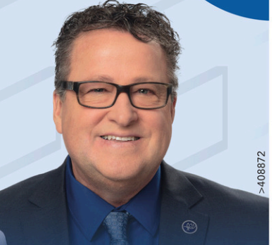
DONALD MARTEL Député de Nicolet-Bécancour