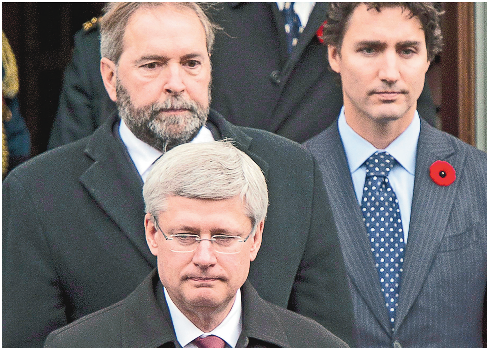
Les chefs Thomas Mulcair (Nouveau Parti démocratique), Justin Trudeau (Parti libéral) et Stephen Harper (Parti conservateur)