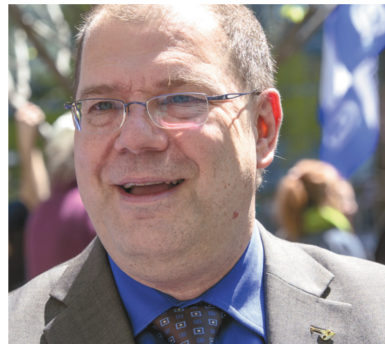
Mario Beaulieu, chef du Bloc québécois