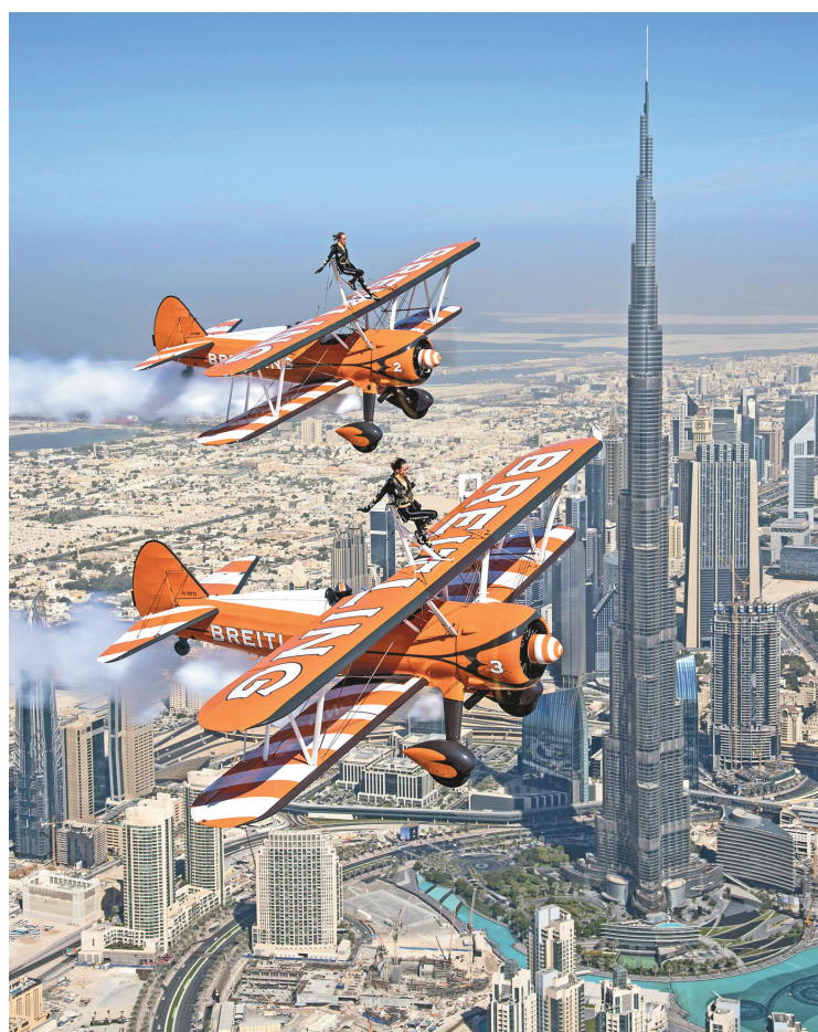
Des acrobates participent à un spectacle aérien au-dessus de l'émirat. En arrière-plan, le plus haut gratte-ciel du monde.