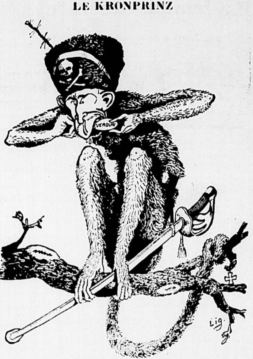
LE SINGE.—Maudite noix!... Va-t-elle me casser les dents?