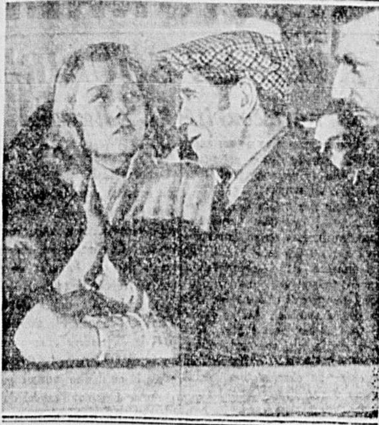
La belle artiste EDWIGE FEUILLÈRE et PIERRE LARQUEY dans une scène du film "L'Emigrante", qui prendra l'affiche samedi, au St-Denis.