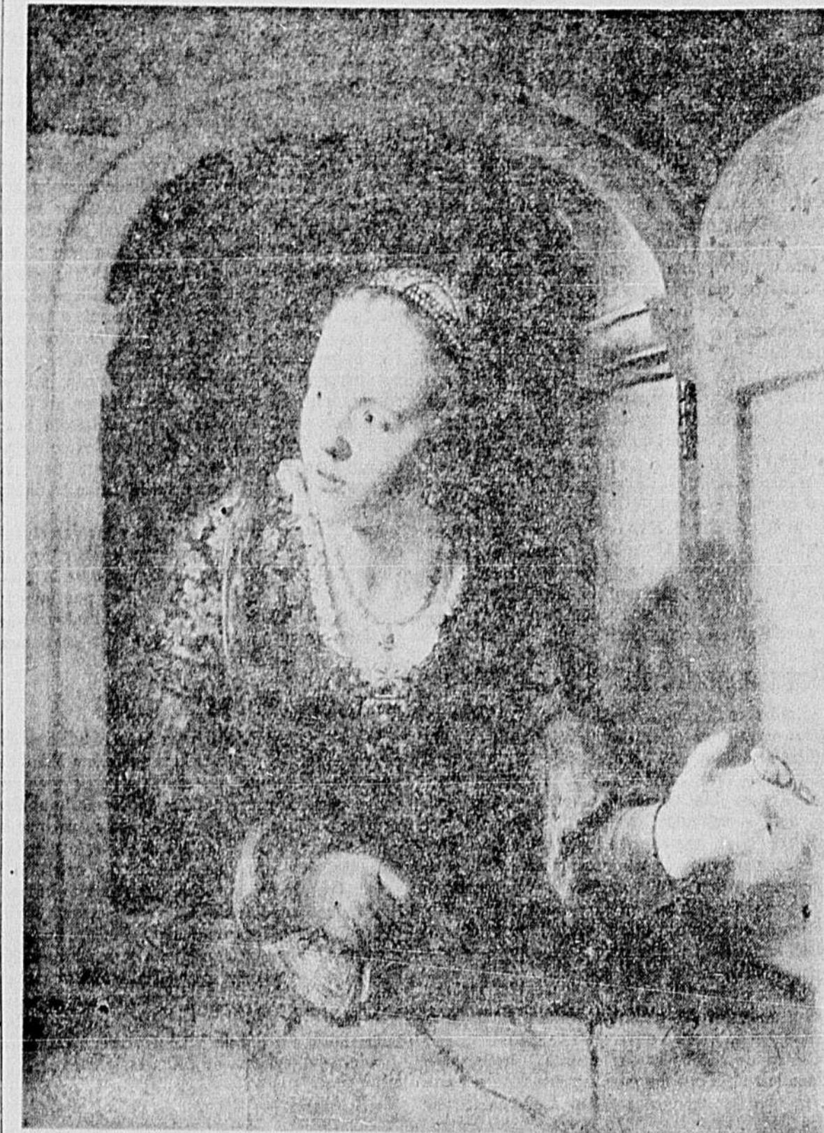
"La femme à la fenêtre", du maître hollandais Ferdinand Gol.

particularités sur les gouvernements démocratiques et en établissant que ne ressembleront nullement à la Constitution américaine ou au système parlementaire britannique. Evidemment, on peut avancer que l'Europe n'est qu'une unité géographique. Je crois que c'est beaucoup plus que cela en réalité. C'est une condition de pensée, et cette exposition illustre magnifiquement ce fait.