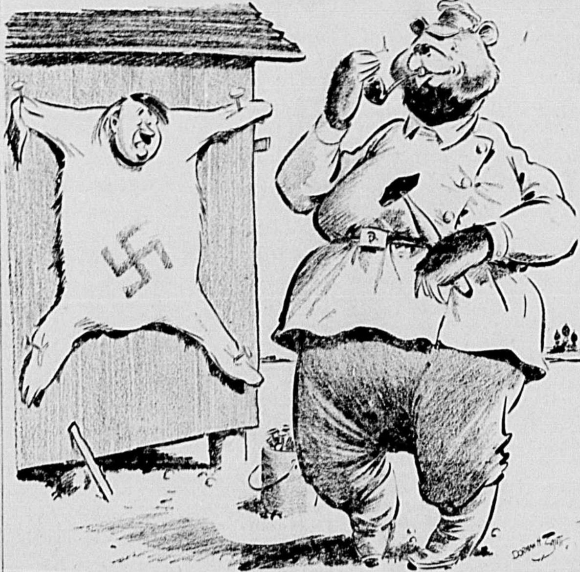
... qu'à tanner la peau dans la bête