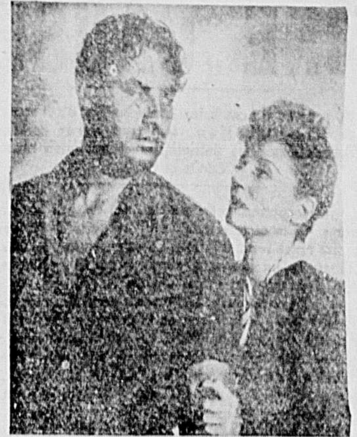
JOHN HODISK et TALLULAH BANKHEAD dans "Life Boat", au Capitol, à partir de vendredi.