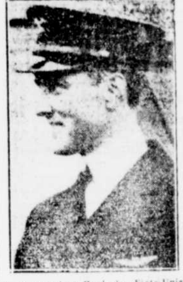
Le commandant Byrd, des Etats-Unis, qui attend patiemment une température favorable avant d'entreprendre l'expédition Paris-New-York avec son avion à trois moteurs.