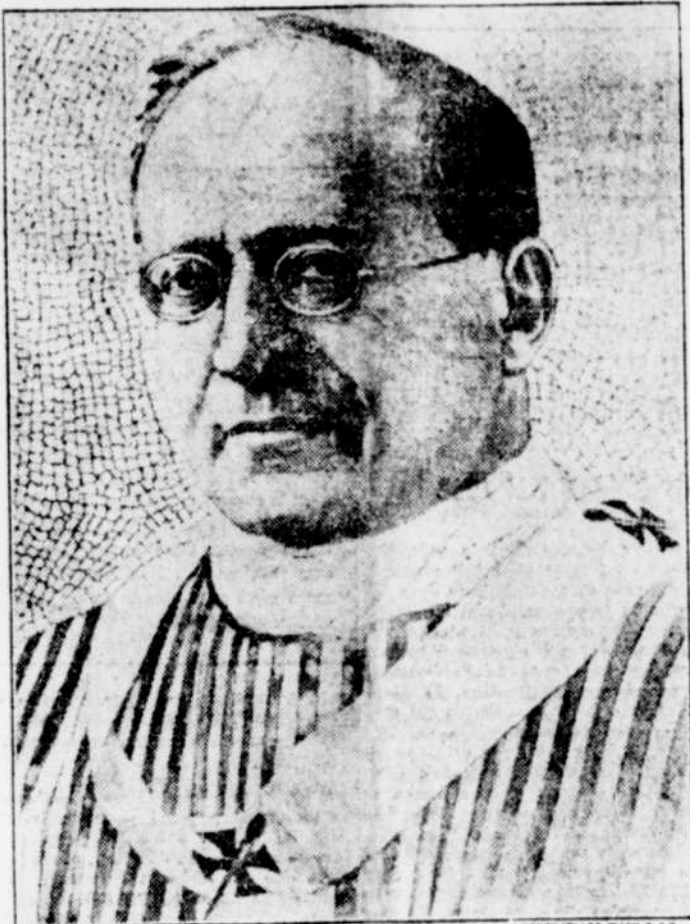
Un nouveau portrait de Sa Sainteté le pape Pie XI, par le peintre italien Rudolfo Vilani. Il est fait sur un mosaïque et sera suspendu dans la cathédrale St-Paul.