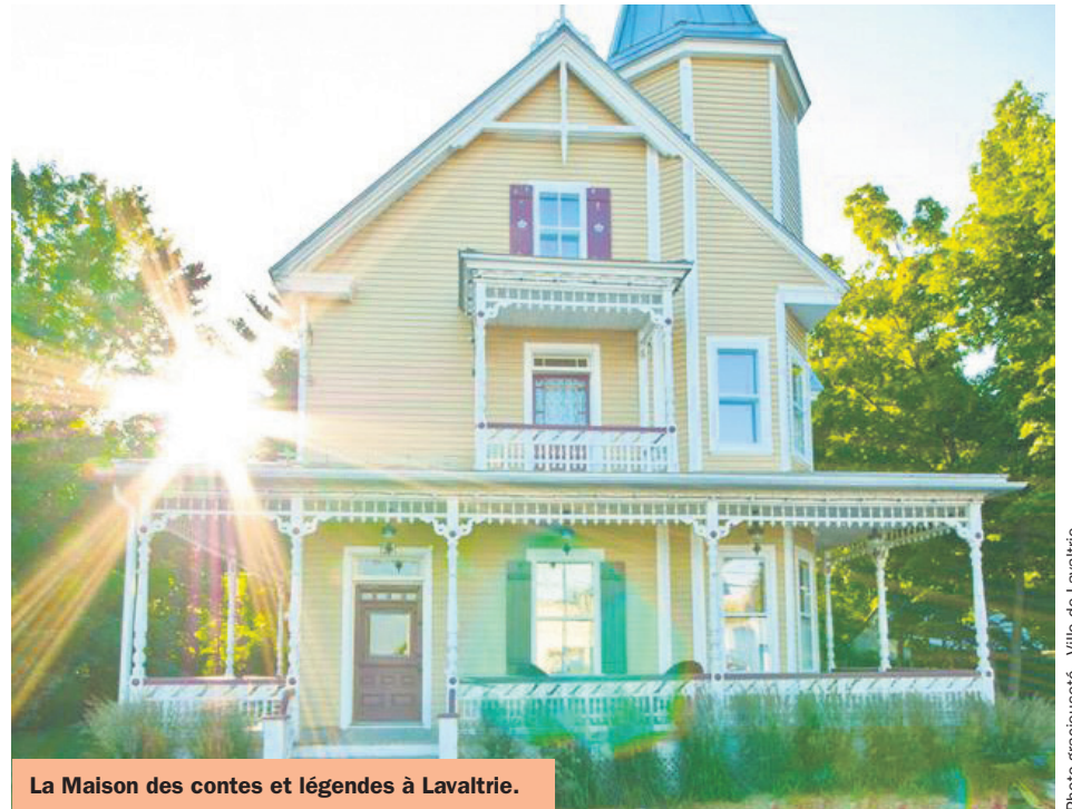
La Maison des contes et légendes à Lavaltrie.