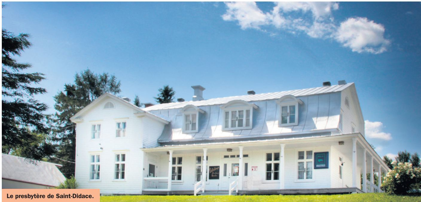
Le presbytere de Saint-Didace.