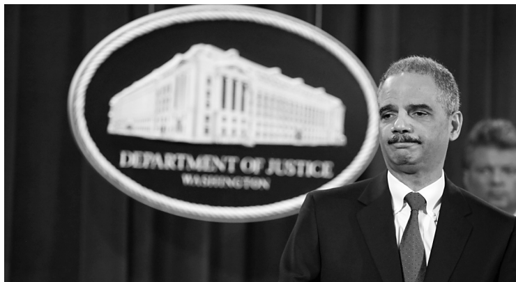
Le procureur général, Eric Holder, a confirmé les poursuites civiles intentées contre Standard & Poor's.

En 2007, un analyste a transmis une vidéo dans laquelle on peut le voir en train de chanter et danser sur une chanson au