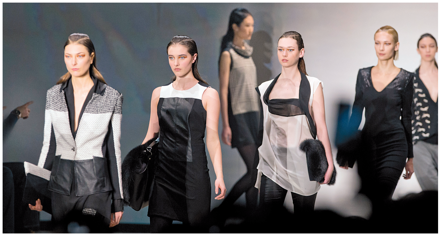
La créatrice de mode québécoise Mélissa Nepton s'est inspirée du monde équestre et du mouvement cubiste pour sa collection automne-hiver 2013, qui joue sur la fluidité et la structure de la silhouette.