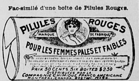
Fac-similé d'une boîte de Pilules Rouges.

Tous les maux, toutes les souffrances, toutes les maladies que la femme a si souvent à supporter, les maux de tête, les maux de gorge, les migraines, les névralgies, les vertiges, les suffocations, les palpitations, les étourdissements, les pâles couleurs, les nervosités, les moments de tristesse, de mélancolie, de découragement, toutes les difficultés qu'elle a bien des fois pour traverser les périodes plus ou moins critiques de son existence, n'ont souvent d'autres sources que l'anémie. Le premier soin d'une femme qui n'est pas bien portante, qui souffre ou qui est affaiblie, soit par la maladie, soit par toute autre cause, doit donc être de se procurer les Pilules Rouges de la Compagnie Chimique Franco-Américaine qui guérissent chaque jour tant de femmes, de jeunes filles, de jeunes mères, de femmes âgées atteintes de différentes maladies qu'aucun autre remède ne parvient à guérir.